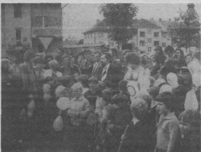
Poročali smo že, da je bil sredi maja odprt drugi vzgojno-varstveni zavod v naši soseski. To pot objavljamo sliko z odprtja. Mlado in staro se je razveselilo novega vrtca, saj so z njim omiljene težave, ki na tem področju pestijo našo sosesko.