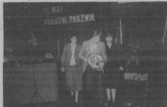
Krajani Most so se 15. maja množično zbrali v dvorani telovadnega društva Partizan in s krajšim kulturnim programom ter s podelitvijo priznanj zaslužnim krajanom počastili praznik svoje krajevske skupnosti. Ob tej priložnosti so tudi položili venec pred spominsko ploščo na stavbi krajevske skupnosti ob Zaloški cesti. (Na sliki: delegacija krajanov nese venec) D. J.