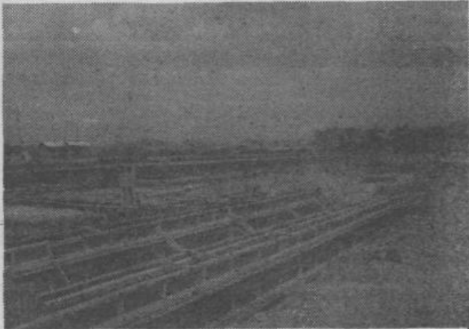
Od temeljnega kamna do temeljev za ves vrtec ob Cerutovi cesti je več kot korak.