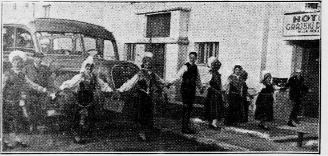
Pred hotelom Grajski dvor v Radovljici

Bled, 13. maja. Na svojem romanju skozi najlepše pokrajine slovenske zemlje so zastopniki tujsko-prometnih agencij iz osmih evropskih držav doživeli slični obhiti v Bohinjskem jezeru najbrž enega najčudovitejših večerov. Škoda je bila samo, da so se z izletom do Zlatoroga in Savice ter z ogledom Sv. Janeza, Starih Fužin in divjeromantične doline Mostnice toliko zamudili, da jih je zajela noč, in ko so se povzpeli do hotela Bellevue, položena na krasno razgledno točko, niso več utegnili uživati bajne krasote barv, v katerih se razigrava solnčni zaton nad sivimi vršci Triglavu in bregovi pod njim. A še v zgodnjem večeru so mogli gostje vsaj od daleč zaslišati lepoto triglavskega sveta, in čeprav je bilo mnogo izkušenih popotnikov, ki od blizu poznajo gorstva Evrope, med njimi, so v spominu skorajda zaman iskali primere užitku.