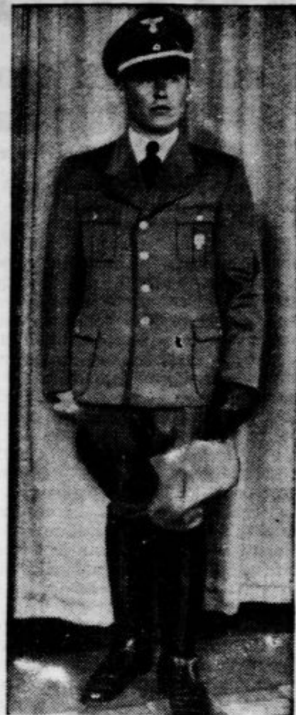
O priliki Hitlerjevega obiska v Rimu so se pokazali nemški novinarji prvič v predpisani uniformi (slika)