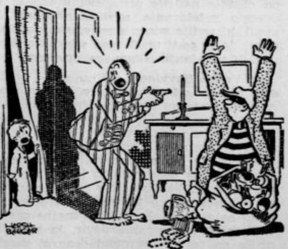
»Oče, ne streljaj — samočres je prazen!« (»Everybody's weeky«)