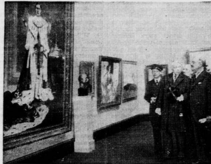
Prezident Francije ogleduje v Parizu razstavo s portretom angleškega kralja Jurija VI. Sliko je izvršil slikar John Lander