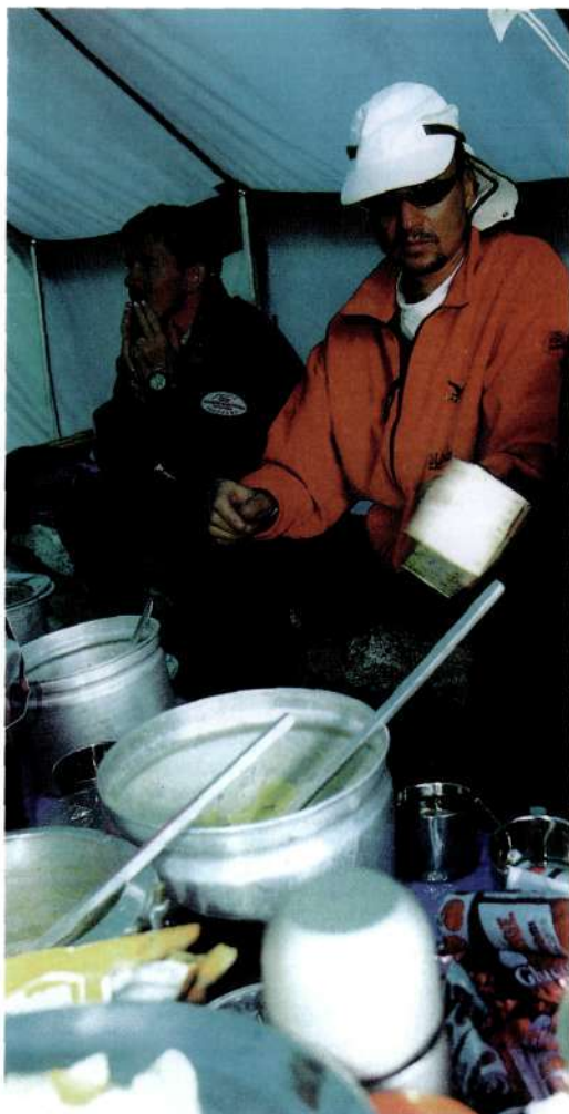
V baznem taboru pod Everestom: zaskrbljenost pred odločilnimi vzponi.