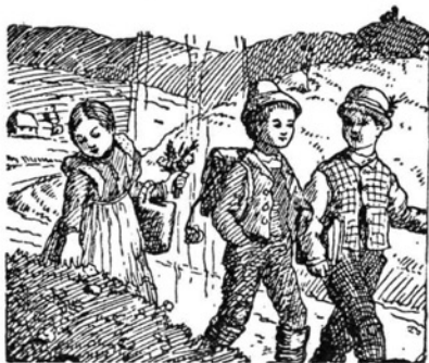
Na potu v šolo.

čeprav jih sami plačujejo in vzdržujejo. Učitelji so postali uradniki, ki morajo z otročiči govoriti v »uradnem« jeziku, čeprav otroci tega jezika ne razumejo. Iz vzgojevalnic smo dobili potujčevalnice in jeza ter odpor proti taki nenaravni šoli raste dan za dnem v grozno škodo izobrazbi in vzgoji.