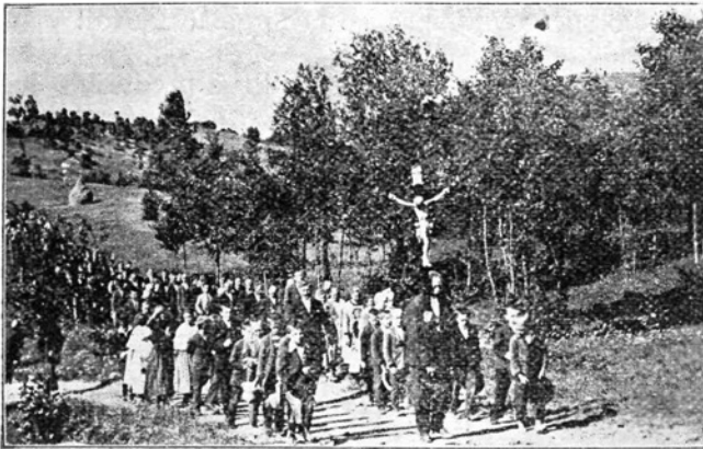
Fantovsko romanje na Mar. Celju: Del procesije.

Okrog devetih je pa zapihal veter in razpodil oblake. Krn se je prikazal in Matajur odkril. Po rebru so dohajali iz Kanala oddelki romarjev, med njimi celo fantje iz Sp. Idrije, Črnega vrha, Krasa in Spodnje vipavske. Izredno lepa je bila udeležba romarjev iz Mirna, Povirja, Dornberga, Livka, Ponikev, Kanala, Gorenjega polja i. t. d. Prostor pred cerkvijo se je vedno bolj polnil. Zvonovi so veselo pritrkavali, fante-romarji so se pozdravljali in solnce je predrlo oblake. Domači gostilničarji so ljubeznjivo stregli došlecem z gorko pijačo. Naenkrat se oglase rogovi: Goriški godbeni krožek prihaja! Vse je drlo nasproti mladim godbenikom, ki so se korajžno uvrstili