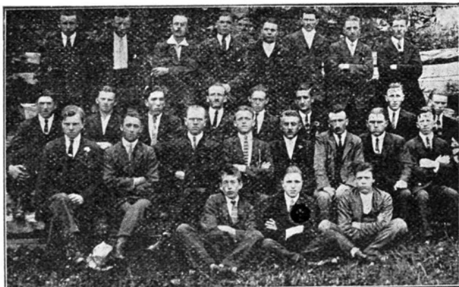
Prosvetno društvo na Marijinem Celju.

Godba je še enkrat zaigrala v slovo, pevci so zapeli pesem, fantje zavriskali in v veselem razpoloženju, polni solnca v svojih dušah, odhiteli širom naše dežele domov.