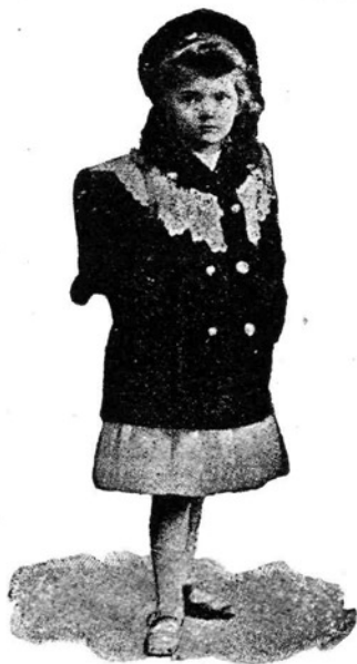
Prvič v šolo.

Pa pridejo leta, ko otrok doraste in prestopi drugi prag v drugo družino t. j. v šolo. Otrok pričakuje, da bo našel v šoli drugi dom, da mu bo