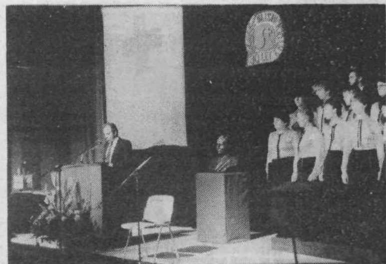
Slavnostna proslava ob obletnici krvodajalstva v domu Ivana Cankarja