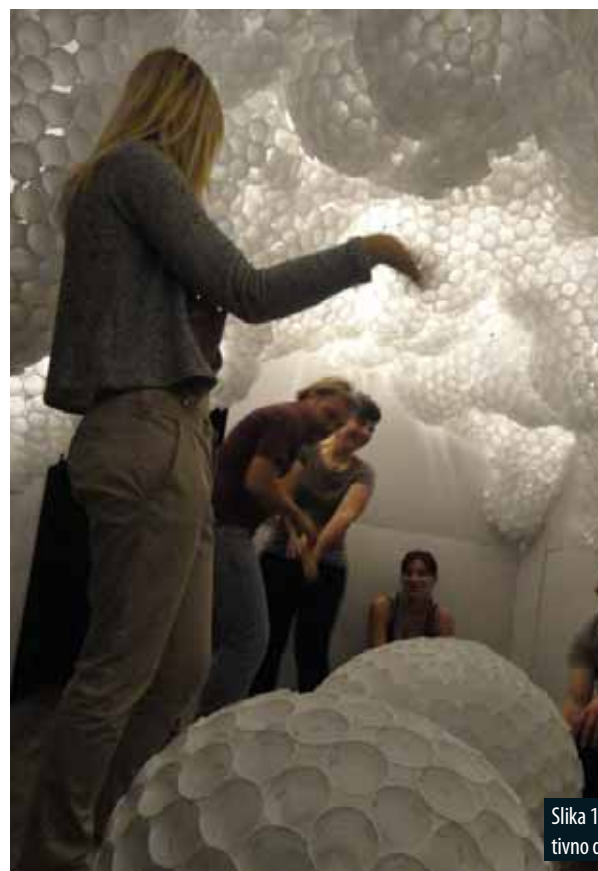
Slika 1: Ustvarjalno in kreativno delo na delavnici.

Workshop 3 (April 2013): material – white plastic cups; clipping of elements into curves; stacking and folding of surfaces into a composition; making a 3D composition of a room; finalising the composition of a "leisure room"; shaping the ambient and the individual elements, circle, observation of structure.