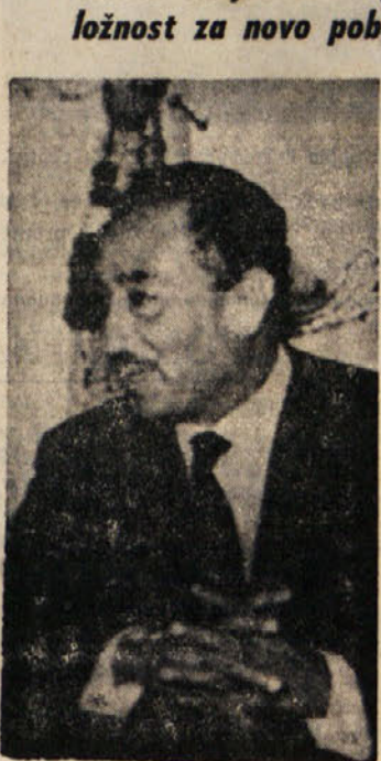
Egiptovski predsednik Sadat

Ohod sovjetskih vojaških svetovalcev iz Egipta naj bi nudil IZA priložnost za novo pobudo - Poslabšanje odnosov med Sirijo in Egiptom?