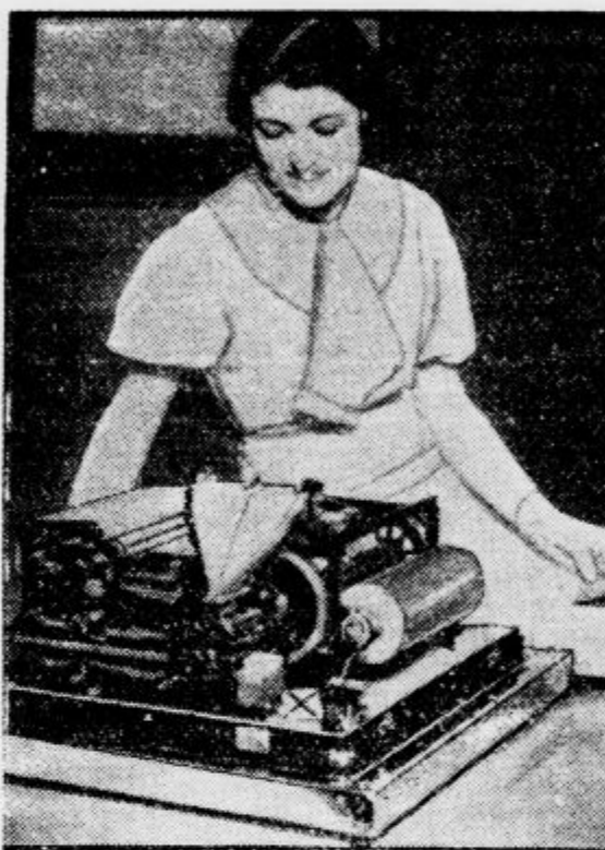
Ta model velikega rotacijskega stroja za tiskanje časopisov je izgotovila neka ameriška tvrdka. Razstavila ga bo na svetovni razstavi v Chicagu

Pri utrujenosti, razdraženosti, tesnobi, nespajni, srčnih nadlogah, tesnobi v prsih, poživi naravnava »Franz Josefov« grenčica, trajno obtok krvi v trebuhu in učinkuje pomirjevalno na njeno valovanje. Profesorji za bolezní prebavil izjavljajo, da se »Franz Josefov« voda pri pojavih, ki imajo svoj izvor v zastrupljenju želodčnega črevesnega kanala, obnese kot izborno odvajalno sredstvo. »Franz Josefov« grenčica se dobi v vseh lekarnah, drogerijah in specerijskih trgovinah.