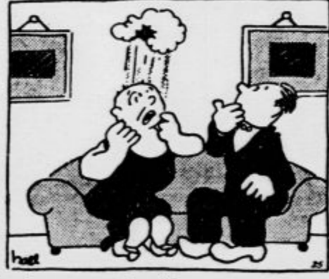
Sesalo za prah. (Draraz v dveh nad-stropjih).