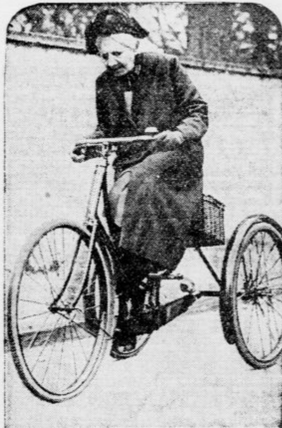
Ta starka v Hullu na Angleškem se vozi pri svojih 96 letih še vsak dan na triciklju in ne čuti pri tem nobenih starostnih tegob