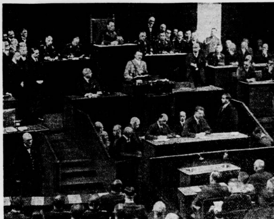
Nemški državni kancelar Hitler med svojim ekspezejem v sredo 17. t. m.