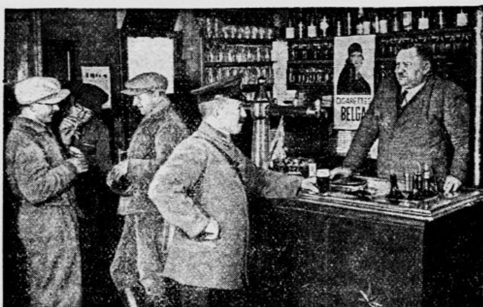
Ta gostilna v ozemlju Eupen-Malmedy ima čudno lego, da stoji gostilničar z mizo, sodi in steklenicami na belgijskih tleh, njegovi pivci pa na nemškem ozemlju. Kupčija baš zaradi tega sijajno uspeva