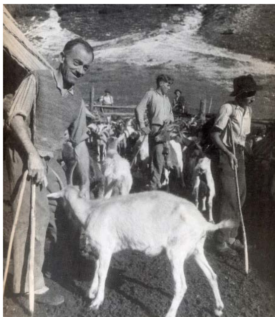
Planina Zapotok; na merni dan, leta 1950 (foto: Jaka Čop, objavljeno v knjigi Trenta in Soča).