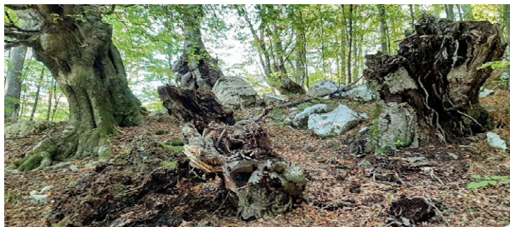
Štori ali grmi v gozdu nad Drežniškimi Ravnami kot primer gojenja drevca za potrebe drv