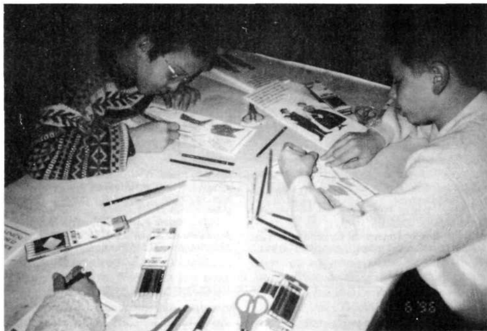
Muzejska delavnica. Otroci izdelujejo par v praznični narodni noši

Jeseni leta 1995 smo na omenjeno delavnico povabili četrtošolce iz osnovnih šol v Škofji Loki, Železnikih, Poljanah, Gorenji vasi in Žireh. Sledilo je vabilo gorenjskim četrtošolcem, v prihodnje pa načrtujemo obiske iz celotne Slovenije. Upamo, da bo tudi tovrstna pedagoška aktivnost našega muzeja naletela na enako ugoden odziv kot že doslej uveljavljene oblike.