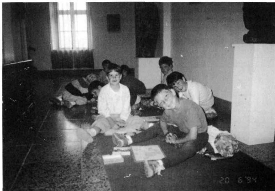
Program za najmlajše »Gal v muzeju in galeriji« Otroci rišejo likovne umetnine v muzeju