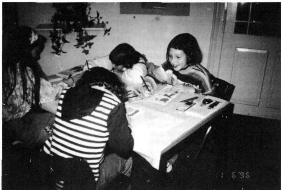
Muzejska delavnica. Otroci izdelujejo par v praznični narodni noši