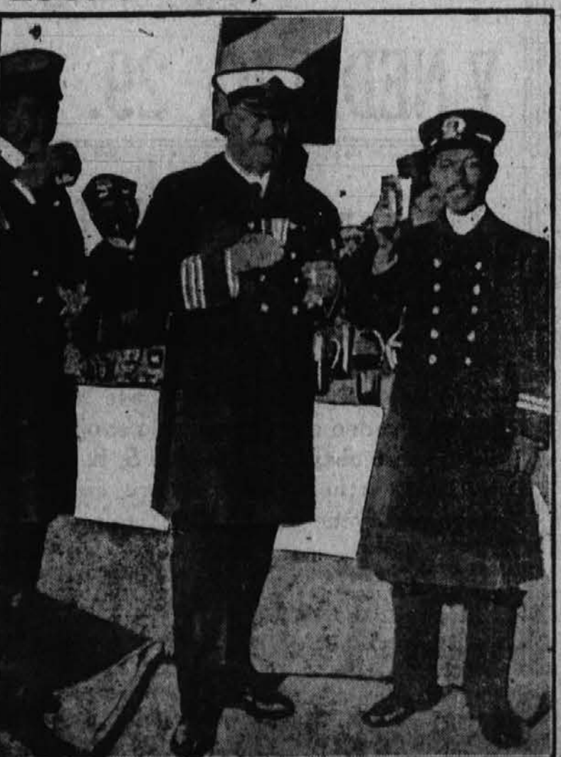
These English and Japanese naval officers are drinking a toast to the British-Jap alliance. And it's not grape juice that they are quaffing. (No sirree!) A neat argument against prohibition is the fact that the German, French and English armies, which have borne the brunt of the fighting, allow their soldiers to use liquor.