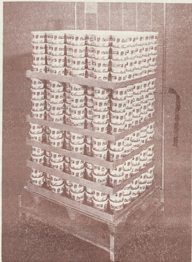
Industrija konzerv v veliki meri opušča uporabo klasičnih kartonov ter pristopa k embalaranju raznovrstnih konzerv na različne palete

ga zraka do razstavljenega blaga na drugi strani pa ohranja potrebno temperaturo na idealnem nivoju, kar prispeva k manjši porabi energije. Kot posebnost je ta firma prikazala hitro zložljivo hladilno komoro, ki se lahko postavi kjer koli in priključi na že obstoječe kompresorje za hlajenje.