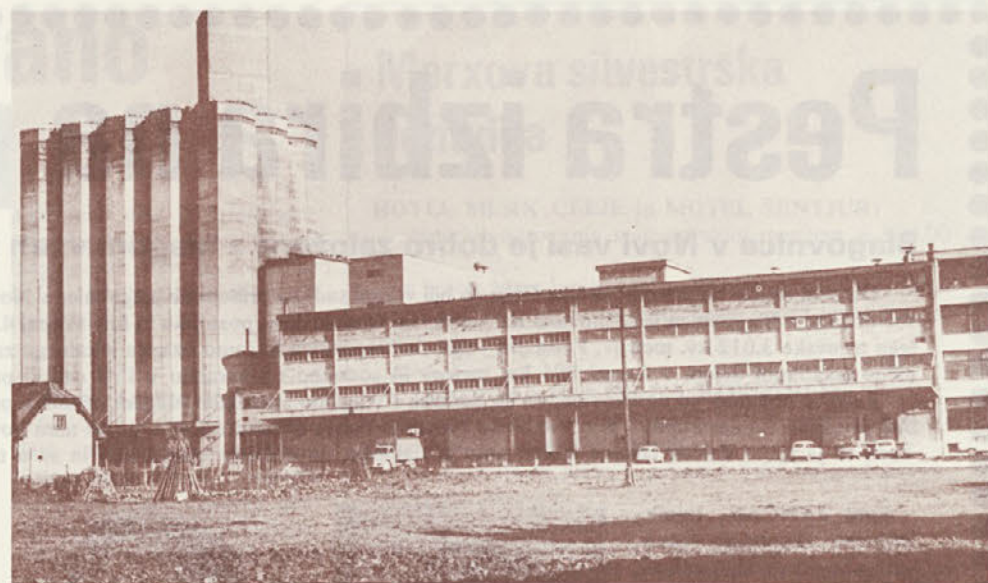
Na Hudinji v Celju, severno ob obstoječih silosih Mlinsko predelovalne industrije, bo prihodnje leto zraseden, štiricelični silos.