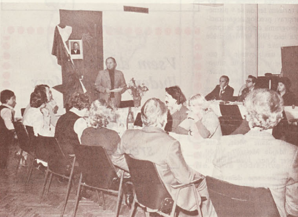
S programsko volilne konference osnovne organizacije zveze komunistov delovne organizacije Teko