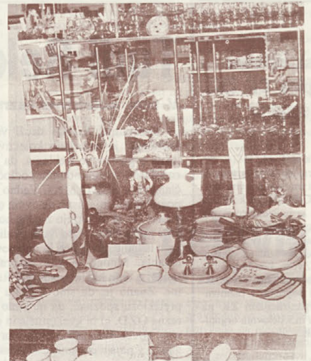
Dobro je založen tudi oddelek kristala, porcelana in keramike