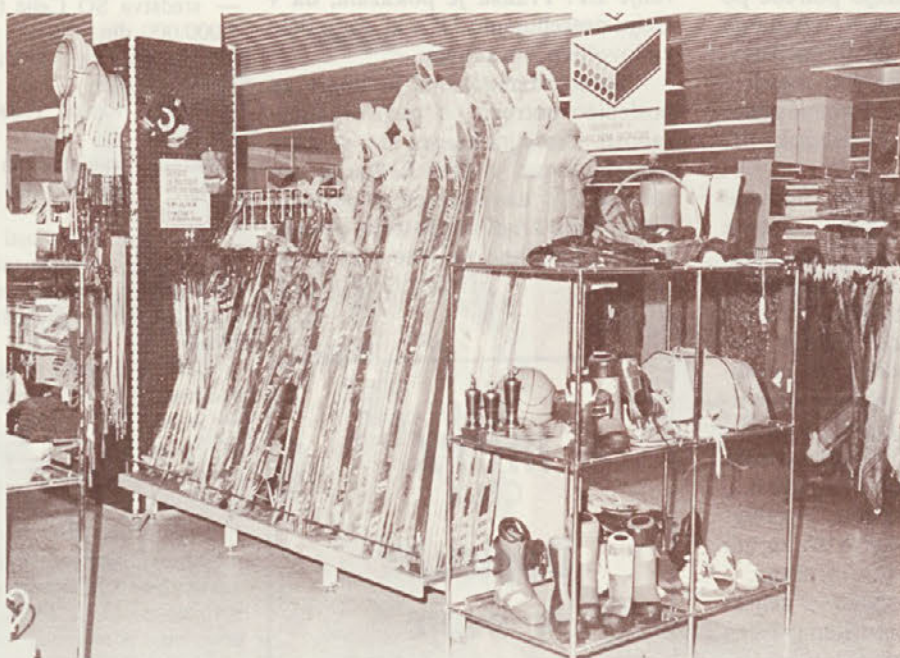
Pri nakupu športne opreme vam bodo pomagali z nasveti