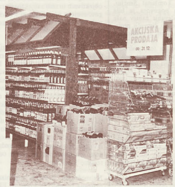
Akcijska prodaja blaga bo trajala vse do novoletnih praznikov