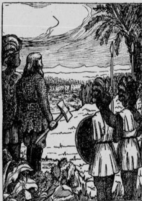
»Oj, to so v resnici možje, zopet so zmagali!« je vzkliknil Ignosi.

Nato smo prišli mi — to je »Bivoli« — doli na zelenico in se ustavili kakih sto korakov za poslednjo vrsto »Sivih« in na nekoliko vzvišenem prostoru. Dovolj časa smo imeli opazovati Tvaline čete, ki so bile od jutranjega napada same pomnožene in so sedaj kljub vsem izgubam štele gotovo štirideset tisoč mož, ki so se nam počasi bližali. Blizu one zelenice so se ustavili, a hitro so spoznali, da se more v istem času razviti samo en polk v bojno vrsto; hitro so opazili, da jim stoji nasproti polk »Sivih«, ponos in slava kukuanske armade, pripravljen braniti pred njimi