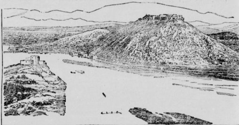
Turška utrdba ob črnogorski meji.

Seveda, svobodomiselnec se ne gre za to, da bi kaj dokazali. Oni svojo ljuliko sejejo tiho, kradoma, da bi jih nihče ne opazil. Na ta način najlozje neuke ljudi vjamejo. Zato je treba nanje paziti. To hočemo tudi mi, ker ne moremo pripustiti, da bi nam kdo naše verno, kleno ljudstvo pokvaril. Vydrova tovarna pa naj si zapomni, da poštena krščanska hiša ne more trpeti lista, ki taji vero v Boga in svete zakramente. Na Češkem taka roba morda gre, na Slovenskem pa ne bo. Ako misli Vydrova tovarna po tem potu nadaljevati, vemo, kaj nam je storiti!