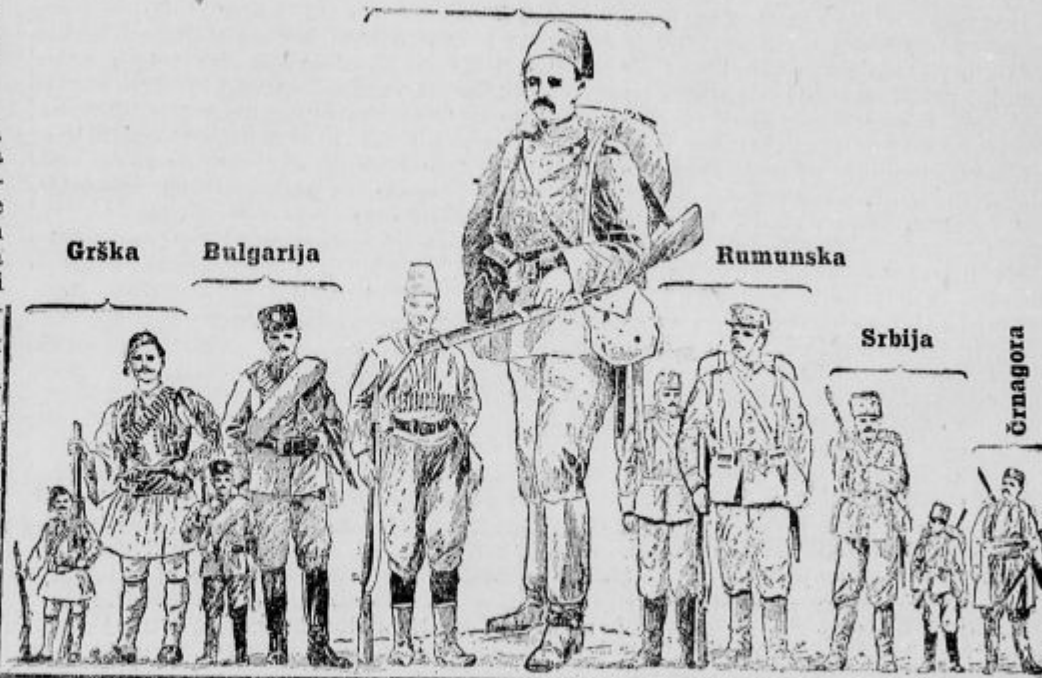
Razlike vojaške moči balkanskih držav v miru in v vojski.

Ljudske Stranke. Na dan 20. oktobra se skliče v Ljubljani velik sestanek vseh slovenskih in hrvaških poslancev in članov izvršilnega odbora, da se dogovore natančno o ustanovitvi velike nove stranke Slovencev in Hrvatov. »Pučki Prijatelj« piše o tem: Naj bi Slovenci prevzeli misel pravaško, Hrvatje pa krščansko prosveto Slovencev.