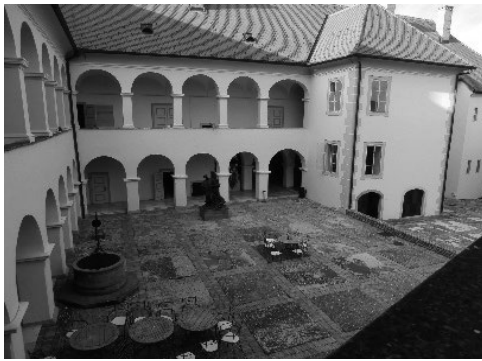
Fotografija 3: 8. oktober 2013.

V muzeju, ki je v baročnem dvorcu, zgrajenem leta 1756 (fotografija 3), so tudi njegove umetniške slike. Npr. v restavraciji oz. jedilnici muzeja je njegova slika o kmečkih opravilih v neki zagorski vasi, velika 240 x 530 cm, ki jo je naslikal leta 1973 ob odprtju muzeja. Umetniška slika prikazuje kmečka opravila od petih zjutraj do petih popoldan v Hrvaškem Zagorju (fotografija 4).