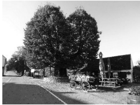
Fotografija 2: D. Trškan, 8. oktober 2013.

nedaleč stran do Gubčeve lipe, ki raste nasproti muzeja in predstavlja simbol zadušitve kmečkega upora (fotografija 2).