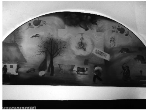
Fotografija 4: D. Trškan, 8. oktober 2013.

Obisk muzeja je priporočljiv za osnovnošolske in srednješolske strokovne ekskurzije o kmečkih uporih. Več o muzeju na spletni strani: http://www.mhz.hr/msb1.html .