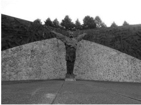
Fotografija 1: D. Trškan, 8. oktober 2013.