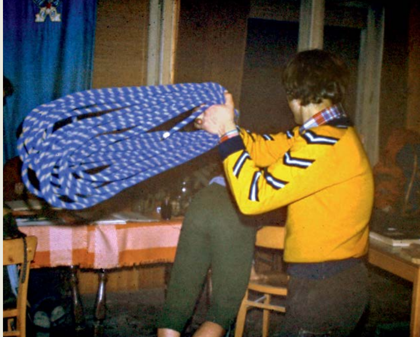
Sprejem med alpiniste 1977

Prav je, da je sprejem med alpiniste nepozaben dogodek, vendar pa – ali je res neizogibno, da se ga bodo tudi prihodnje generacije spominjale po številu in moči udarcev po zadnji plati? Kot je dejal eden izmed plezalskih kolegov: "Bolj malo se spomnim. Vem pa, da sem imel črno, zebasto rit ." Pa v tej svoji izgubi spomina ni edini: "Spomini na moj sprejem so precej zamegljeni. To verjetno pomeni, da ni bilo super prijetno," mi je na vprašanje, kako se spominja sprejema, odgovoril drugi.