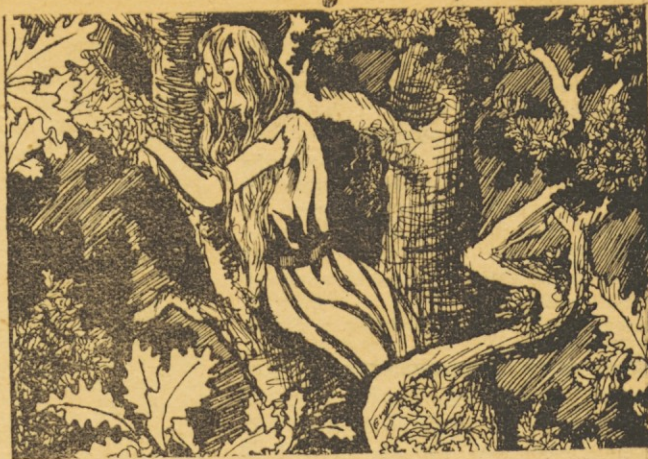
Liubíniza trepó al roble . . .

Liubíniza esperó la aurora sobre el roble. Las manos