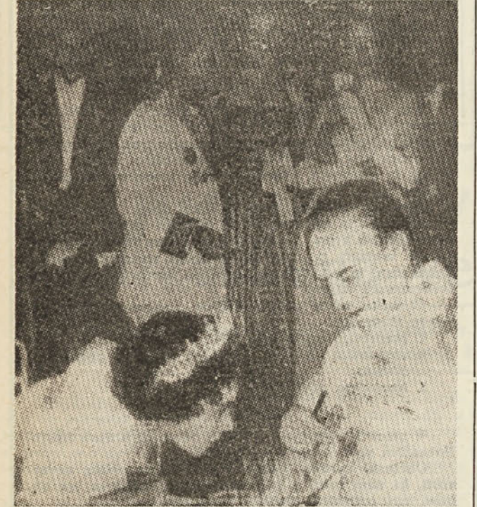
Slika nam kaže grško kraljico Frideriko, ki si radovedno ogleduje Titova odlikovanja. Beograjski paša je bil na svojem obisku v Grčiji zelo darovit iz svojih zaveznikov, monarho-fašistov. Kralju Pavlu je daroval dva tipicana; tudi pri kraljici, dvorjankah in ministrih ni štedil z razkošnimi darili in odlikovanji. Saj je bilo vse plačano z žulji jugoslovanskih narodov!

poslanec Giolitti, član komisije za industrijo in trgovino v italijanski poslanski zbornici, nekaj predstavnikov pristaniškega gospodarstva iz Benetk, gospodarstveniki iz Trsta, strokovnjaki v tem problemu ter pristaniški delavci.