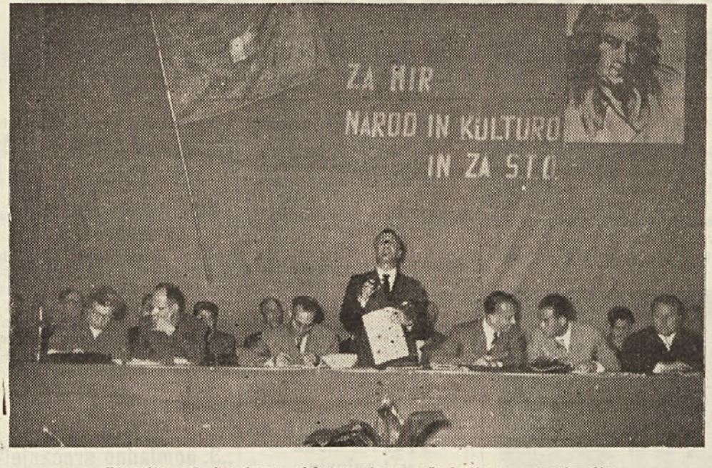
Otvoritev II. izrednega občnega zbora naše kulturne organizacije.