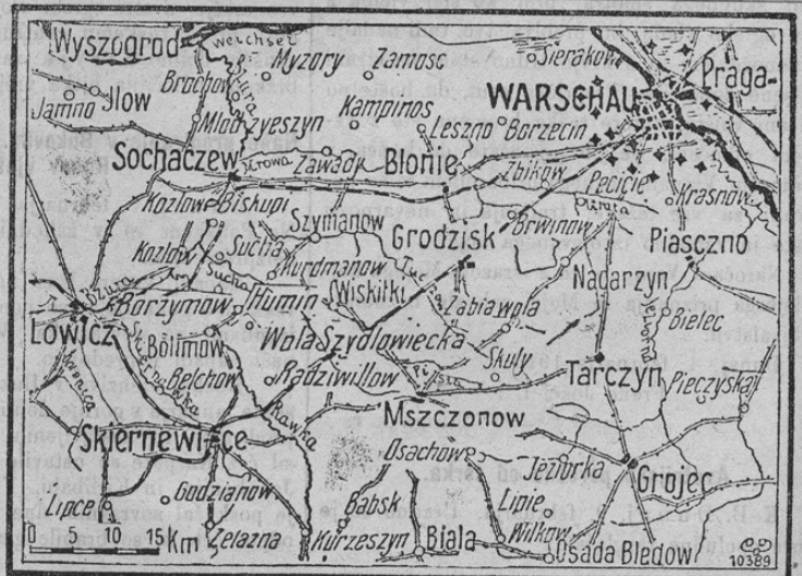
Karte zu den Kämpfen vor Warschau.

Z ozirom na naša uradna poročila o gigantovskih bojih združenih nemških in avstro-ogrskih armad zoper Ruse in zlasti za trdnjavo Varšavo, prinašamo danes mali zemljevid z okolico Varšave, ki bo gotovo cenjene čitatelje zanimal.