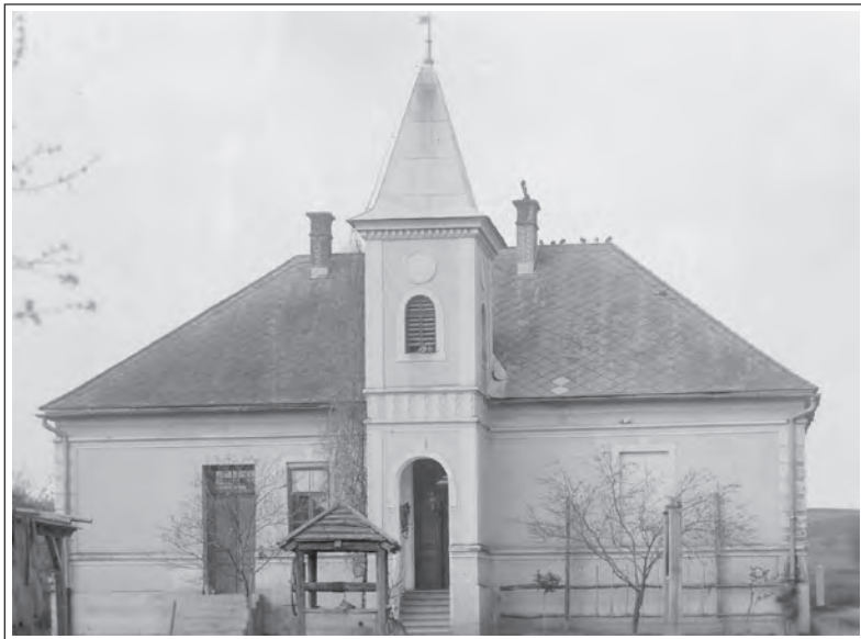
Evangeličanska verska šola zgrajena leta 1914. Od leta 1930 je v teh prostorih delovala državna ljudska šola.

da je danes otrokom pomembna zunanja podoba zvezka, torej da so barvni, porisani z modernimi motivi, skratka privlačni na prvi pogled. Skoraj vsi so si bili enotni, da jih uporabljajo za zapisovanje učne snovi, da jim služijo kot učni pripomoček. Toda globlji pomen jim je pripisal le redki osnovnošolec.