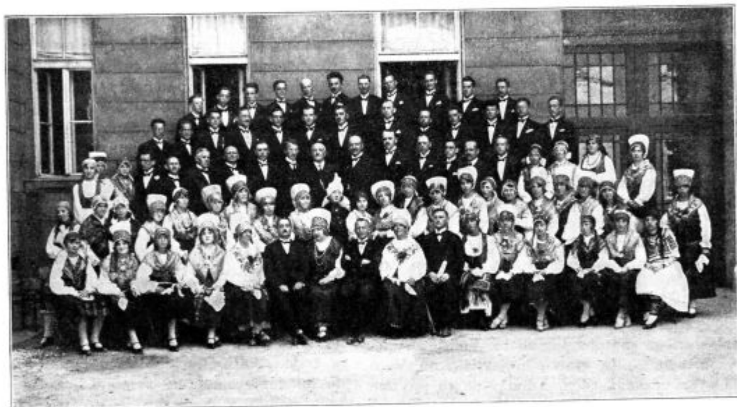
Pevski zbor »Glasbenega društva Ljubljana« je preteklo sredo nastopil v radiu z venčkom narodnih.

Vse pod hissingom omenjene pojave moremo opazovati poleti, pozimi so minimalni. Moremo jih opazovati v obsegu vseh uporabljenih valovnih dolžin, razen najkrajših (pod 40 m).