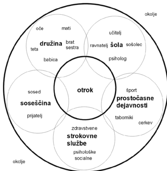
Shema 2: Otrokovo življenjsko okolje (Mikuš Kos, 1991: 11)

Ker motnja v enem delu sistema vpliva na drugi del sistema, moramo v diagnostične (in tudi intervencijske) procese zajeti celoten življenjski sistem. Šele poznavanje tovrstne dinamike omogoča celosten pristop k reševanju posameznikovih težav. Obravnava otroka, ki je v težavah, terja poleg poznavanja