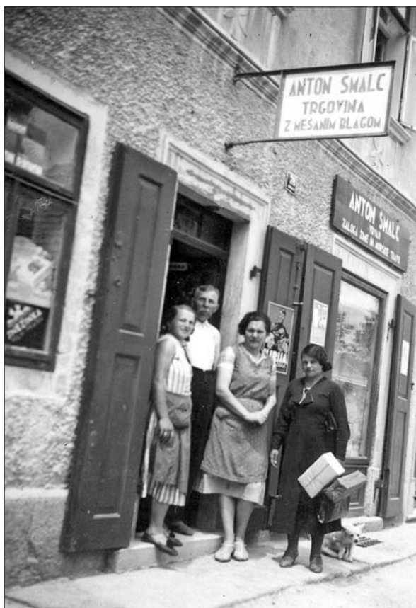
Pred Šmalčevo trgovino z mešanim blagom, kjer so prodajali tudi zaloge žime in morske trave (Digitalna zbirka Muzeja Ribnica, original v zasebni lasti).

V tem poglavju so predstavljene trgovine z mešanim blagom in kramarije. V teh trgovinah je bil izbor izdelkov zelo pester, saj so prodajali od živil in tekstila do gradbenega materiala. V tem sklopu je zabeleženih 26 posameznikov. 131 Od tega jih 12 najdemo