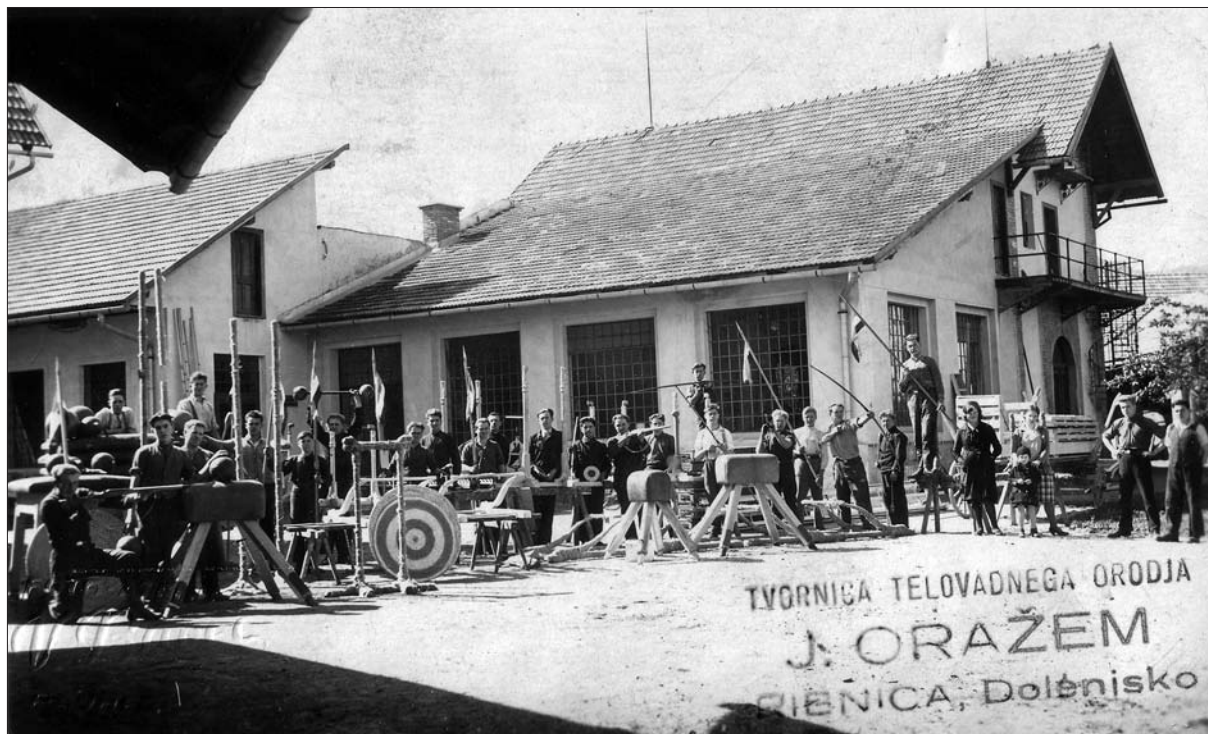
Predstavitve različnih športnih rekvizitov, izdelanih v Tovarni telovadnega orodja – JOR.