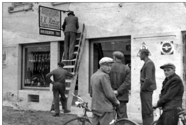
Odprtje Kožarjeve mehanične delavnice in trgovine.

samostojna prodajalna industrijske obutve v Ribnici. Kdaj so jo odprli, ni bilo mogoče ugotoviti, zagotovo pa je že delovala leta 1936.