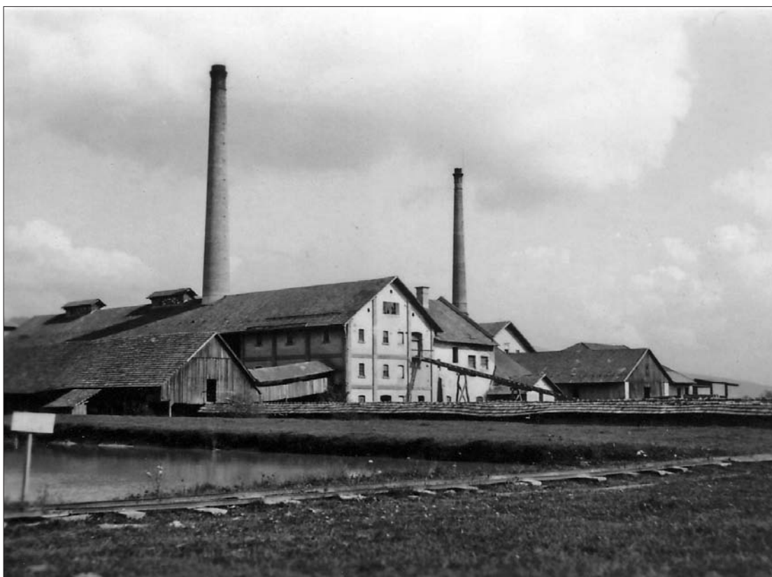
Parna žaga in opekarna v Ribnici (Digitalna zbirka Muzeja Ribnica, original je v zasebni lasti).