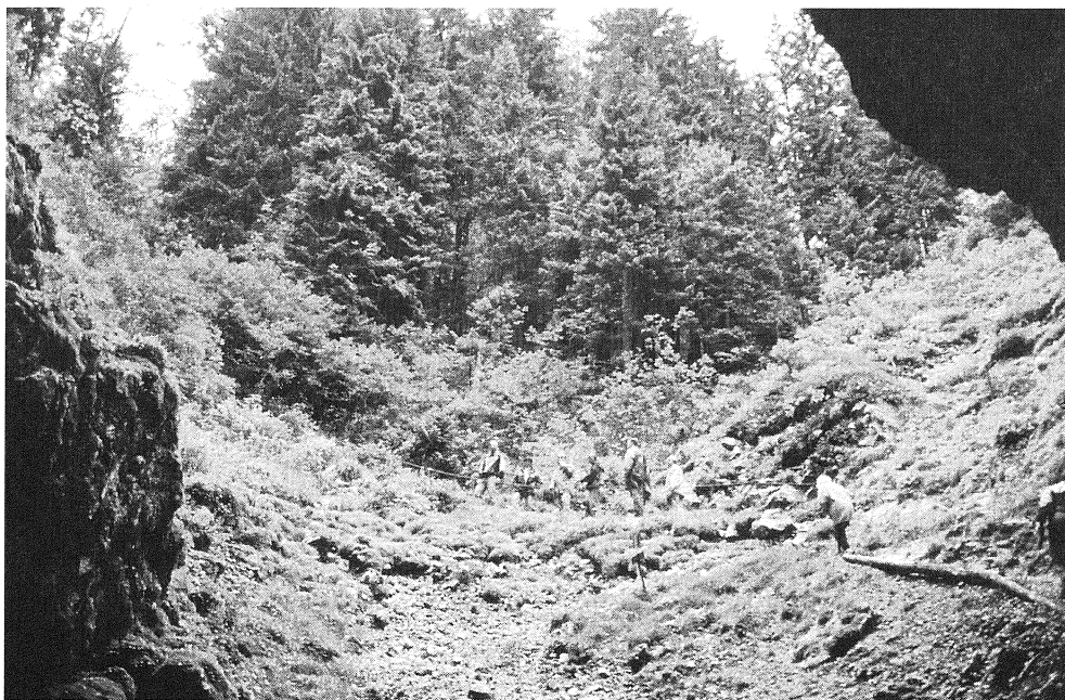
Slika 2: Mrazišče Velike ledene jame v Paradani

V območju večnega snega in ledu so temperature zraka najnižje in tudi najbolj stabilne, v topli polovici leta so med 1 in 3 °C, v hladni polovici pa se spustijo pod ledišče. Višje se temperature, zlasti ob sončnem vremenu v topli polovici leta, naglo dvignejo. V tem primeru je inverzija razvita le v spodnjem delu vrtače do grmiščnega pasu velelistne vrbe. Tu je sončno obsevanje tal in temperatura zraka zaradi nizke in redke vegetacije najvišja, višje pa zaradi senčnosti smrekovega in mešanega gozda temperatura pada. Take razmere smo zabeležili 3.5.1994, ob 12.30, ko smo merili temperaturo zraka na višini 1,8 m in 5 cm nad tlemi (Tabela 2). Nad večnim snegom in ledom je bila temperatura 2,7 °C oziroma 2,4 °C, v pasu alpskih zelišč 6,2 oz. 4,6 °C, v pasu velelistne vrbe pa 15,2 oz. 15,6 °C. V pasu smreke, se je spustila na 11,3 °C (11,2 °C), v pasu mešanega jelovo-bukovega gozda pa na