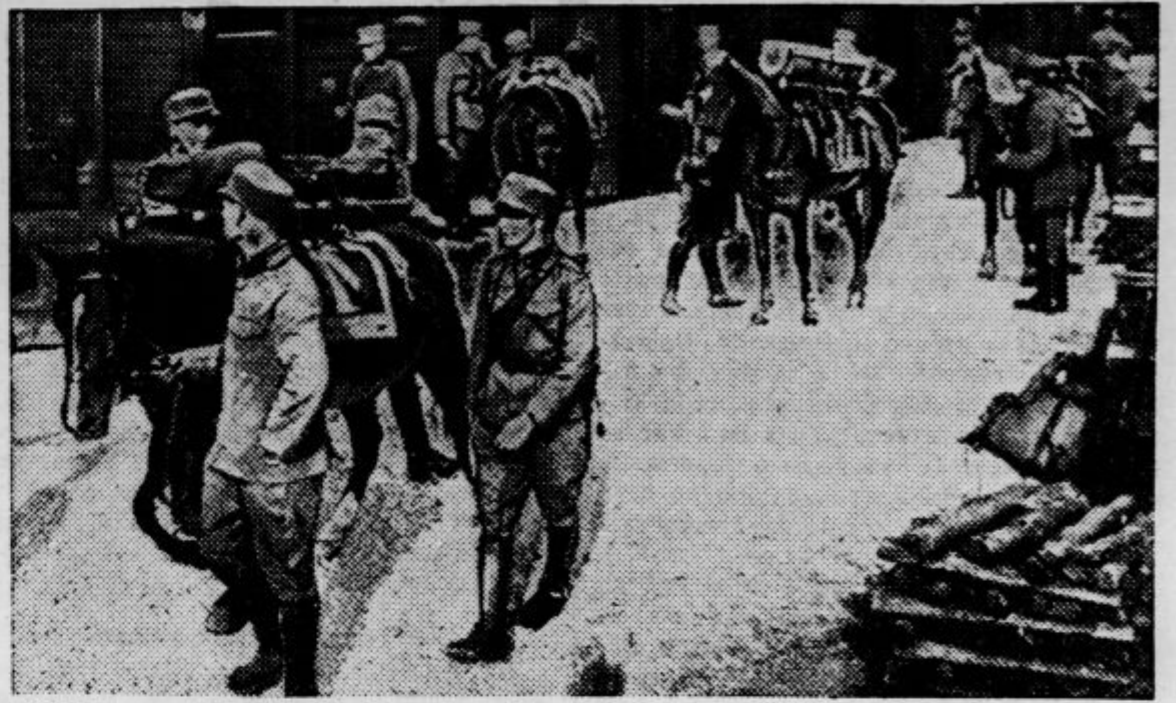
Oddelek nove čete granicarjev za varstvo avstrijske meje proti hitlerjevskim vpadom