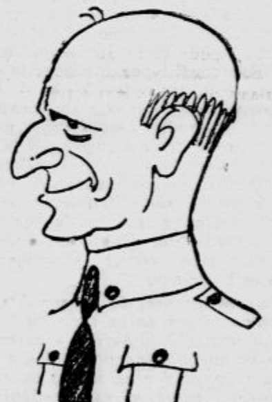
General O' Duffy, vođa irskih fašistov