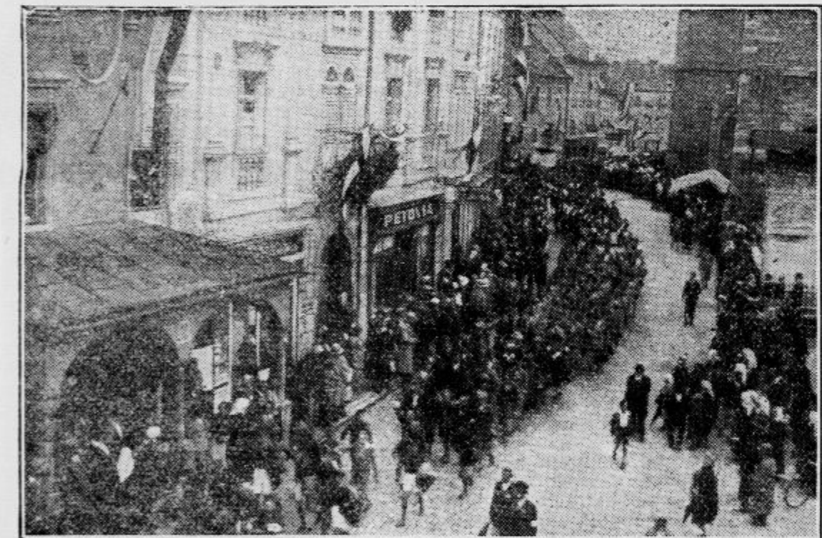
Pogled na del slavnostnega spreveda. Ob obeh straneh gost špalir domačega in okoliškega prebivalstva