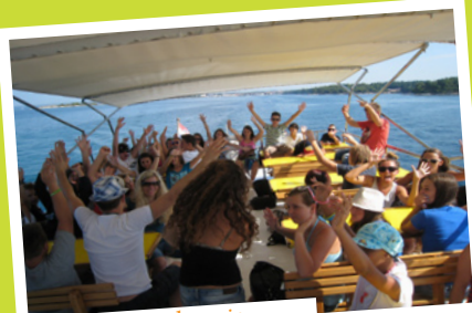
kopanje, plavanje ...