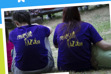
... ponosni in