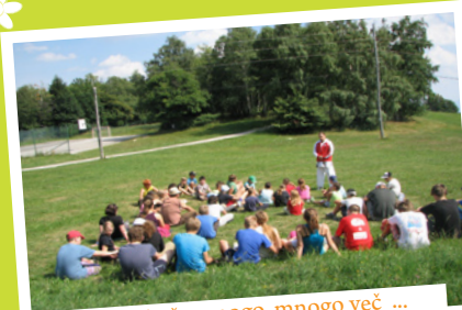
različni in še mnogo, mnogo več ...