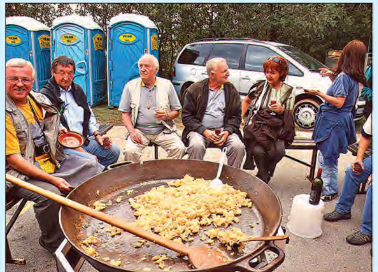
Festival praznega krompirja v Lipi - 9. september 2007