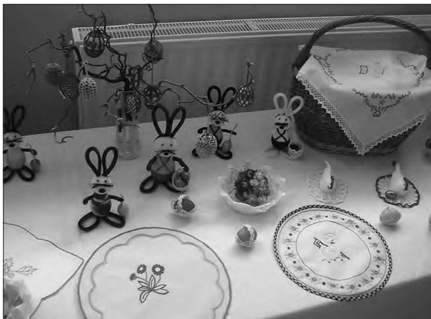
Velikonočni zajčki - paša za oči