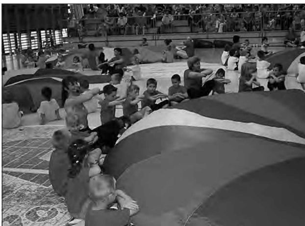
Padala pri plesu majhnih »fitovceve« lahko postanejo vse, kar želimo.