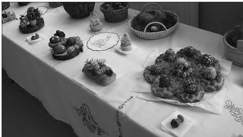
Velikonočna razstava - dobröte in pirhi

Ju-hu-hu, počitnice so tu! Končno smo jih dočakali po napornem učenju. Sedaj je čas za počitek in nabiranje novih moči.