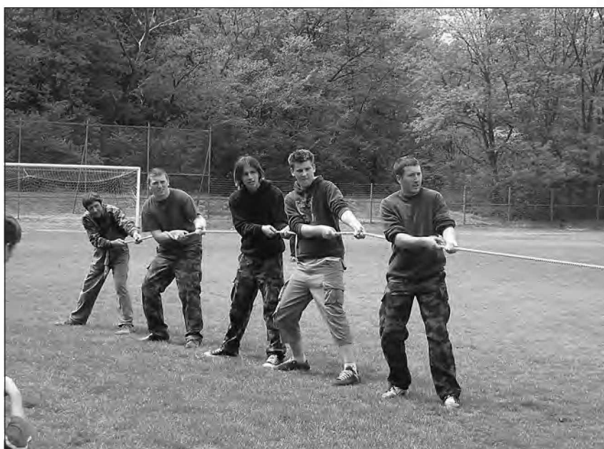
Zmagovalna ekipa - medulične igre v Ižakovcih