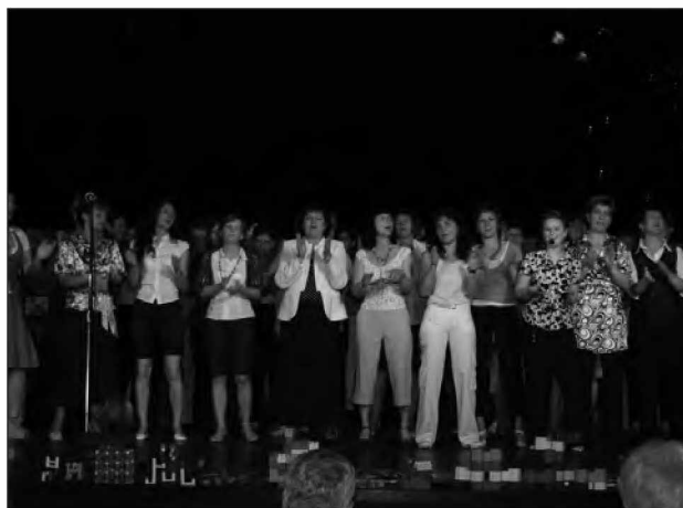
Vrtec beltinci na odru