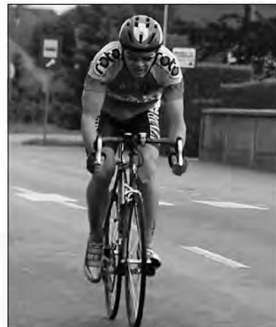
Zmagovalec beltinskega kronometra 2007

terem progo prevozijo, zmagovalec pa je tisti, ki s progo opravi najhitreje. Od leta 2005 smo tovrstni kolesarski dogodek v Beltincih organizirali in izvedli četrtrič. Letošnji je bil poseben po tem, da prvič ni bil namenjen le članom kluba, ampak tudi ostalim rekreativnim kolesarjem. Kljub spet dokaj nestabilnim vremenskim razmeram se je tako 2. junija popoldan na progo