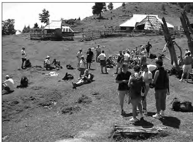
Počitek smo si pošteno zaslužili