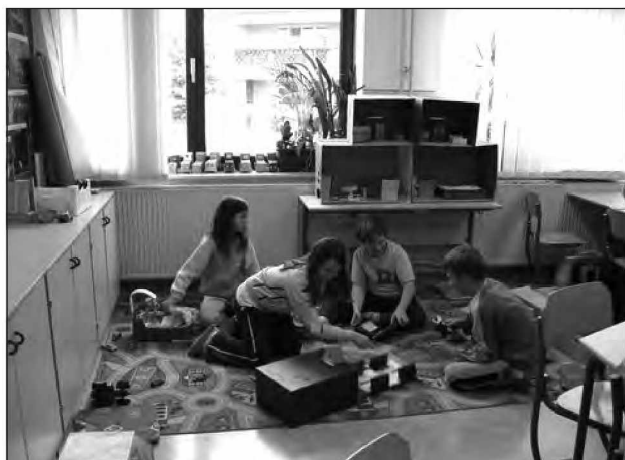
Izdelovanje garažne hiške za avtomobile

Moji učenci so dobili dobro potnico za življenje in učenje naprej. Upam, da se jim bodo njihovi načrti uresničili, da bodo v življenju zadovoljni in uspešni.