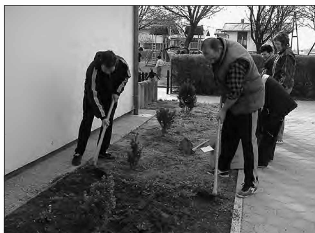
Starši sodelujejo pri urejanju okolice vrtca

okrog vrtca in na igrišču. Pograbbjali smo celotno igrišče, odstranili plevel okrog robnikov in na hribu. Očetje so prekopali oba peskovnika, otroške ročice pa so takoj posegle po lopatkah, vedricah, posodicah in ustvarjalna igra v peskovniku se je začela. Uničene zelenice pred vrtcem so očetje prekopali, odvečno zemljo pa znosili na hrib. Posejali so travo in jo stepta-