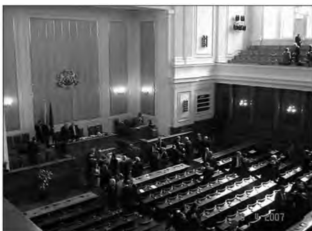
Obisk predsednika evropskega parlamenta