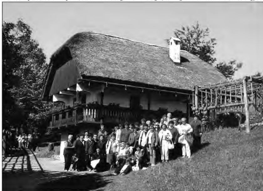
Požar tovarne biodizla v Gančanih

vodila preko Podlehnik in Žetal pod Donačko goro do Rogatca, ki leži na prehodu južnih obronkov vinorodnih Haloz. Ustavili smo se v dolini zelene-ga Posotelja, kjer se na majhnem območju, stisnjem med Donačko goro