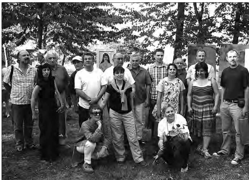
Umetniki na otvoritvi razstave Otona Polaka.