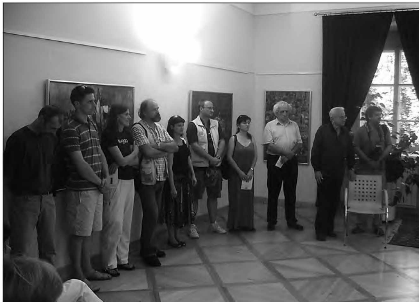
Sodelujoči umetniki na razstavi ob koncu kolonije.