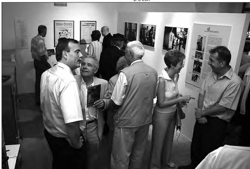
Stalna razstava »Zgodovina zdravstva v Pomurju«