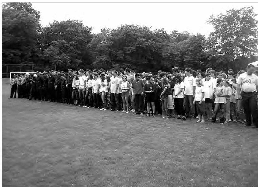
Tekmovalci na Občinskem gasilskem tekmovanju GZ Beltinci

Naša usposobljenost je prišla še kako v poštev ob intervencijah, ki smo jih v letošnjem letu imeli že štirinajst. Tu lahko izpostavimo predvsem požar v tovarni biodizla v Gančanih, kjer so bile naše spretnosti najbolj zahtevane. Ob našem hitrem in učinkovitem ukrepanju smo preprečili, da ni prišlo do večje katastrofe. Za ta požar lahko povemo, da so gasilci ob nudenju pomoči oziroma ob gašenju požara tvegali svoja življenja, saj so bile v goreči tovarni tekočine, ki bi lahko eksplodirale in poškodovale ne samo tam prisotne gasilce, ampak tudi okoliške hiše. Čeprav smo gasilci prostovoljno nudili brezplačno strokovno pomoč, pa so nas številni mediji kritizirali in črnili naše delo, čez da nismo ravnali primerno, da nismo pravilno pristopili h gašenju ipd. Vendar pa lahko na tem mestu povemo, da smo ravnali v skladu z vsemi gasilskimi pravili, saj je naše delo ocenil kot uspešno in pravilno tudi sam vrh slovenskega gasilstva, regijski poveljnik za Pomurje, inšpekcijske službe, policija in kriminalistične službe, ki so skupaj z nami