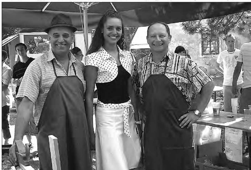
Simpatična dokležovska dečka ob še bolj simpatični miss Slovenije Tadeji Ternar