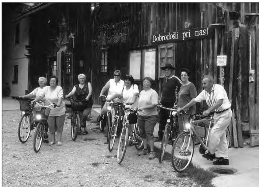
Kolesarji pri Babičevem mlinu

Lepi poletni dnevi so zvalili v naravo, na kolesarjenje, skupino upokojencev iz DU Beltinci. Na pobudo Marice Vučko smo se zbirali ob torkih in petkih pri vrtcu v Lipovcih. Navadno smo se sprti dogovarjali o trasi oz. poti, na kateri smo se počutili varne in smo lahko uživali v brezskrbni vožnji. Srečni smo, da imamo toliko kolesarskih stez, kajti naše ceste so izredno nevarne in ogrožajoče. Kole-