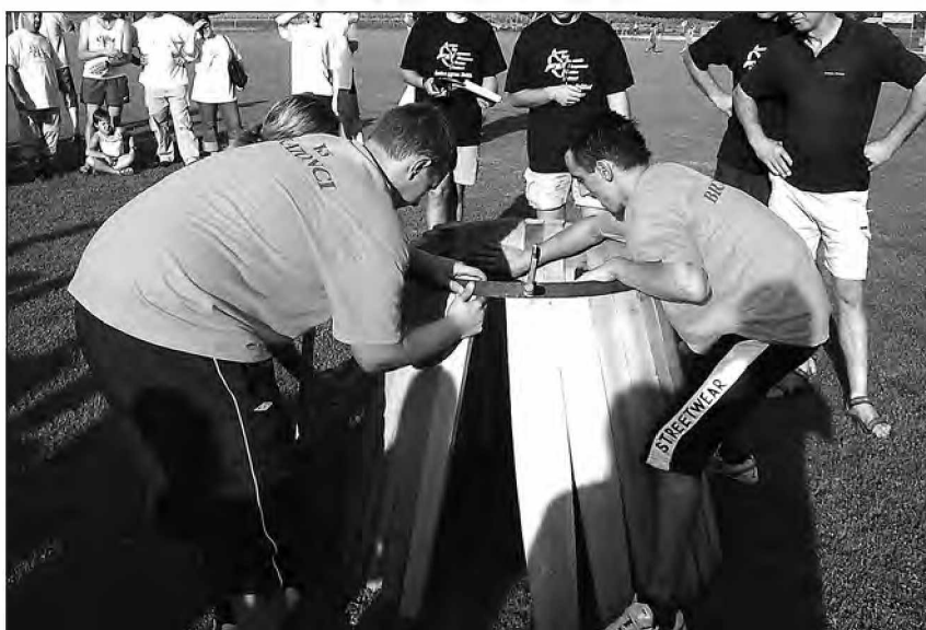
Ekipa Bratonec pri sestavljanju soda

Ena bolj odmevnih prireditev v občini Beltinci so vsekakor tradicionalne vaške igre oz. kot se uradno imenujejo Športne igre krajevnih skupnosti občine Beltinci.