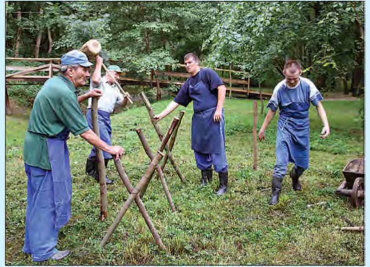
Tradicionalni bújraški dnevi v Ižakovcih - od 9. do 12. avgusta 2007