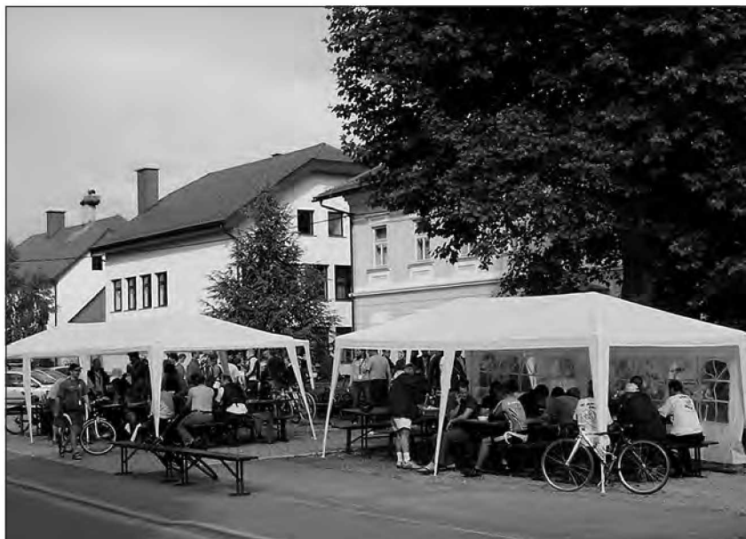
Štartno-ciljni prostor kronometra