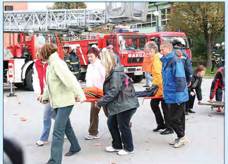
Evakuacijska vaja 13.10.2007 uspela