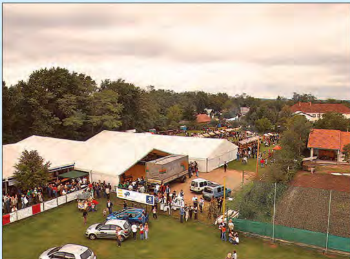
Festival praznega krompirja v Lipi - 9. september 2007