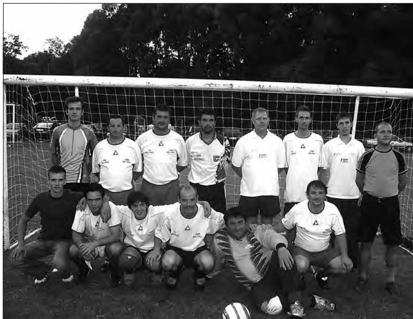
Zmagovalna ekipa KS Beltinci