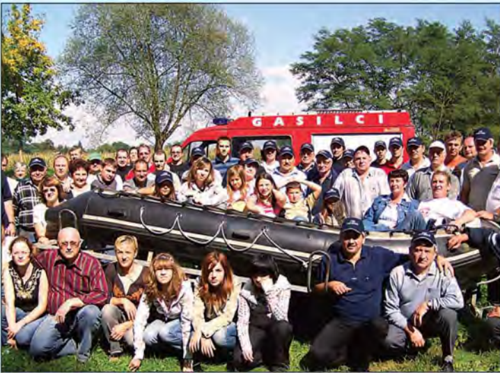
Spust po reki Muri v organizaciji PGD Beltinci ob prisotnosti PGD Radlje ob Dravi, PGD Podčetrtek in PGD Razvanje – 22. september 2007