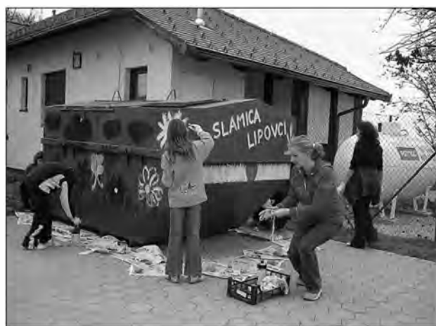
Otroci so polepšali kontejner