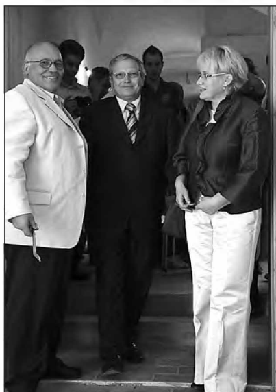
Množični obisk odprtja stalne razstave