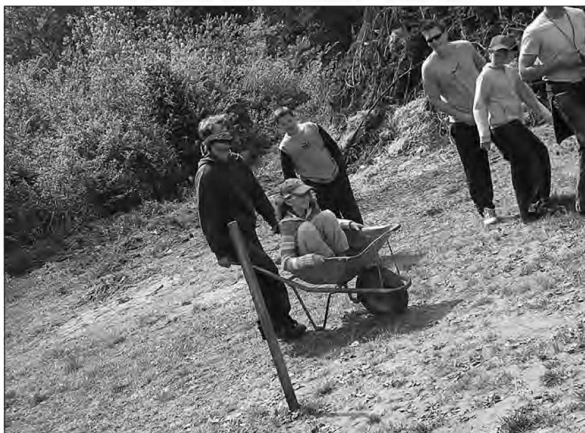
Samokolnica uporabna tudi za igre - domiselno