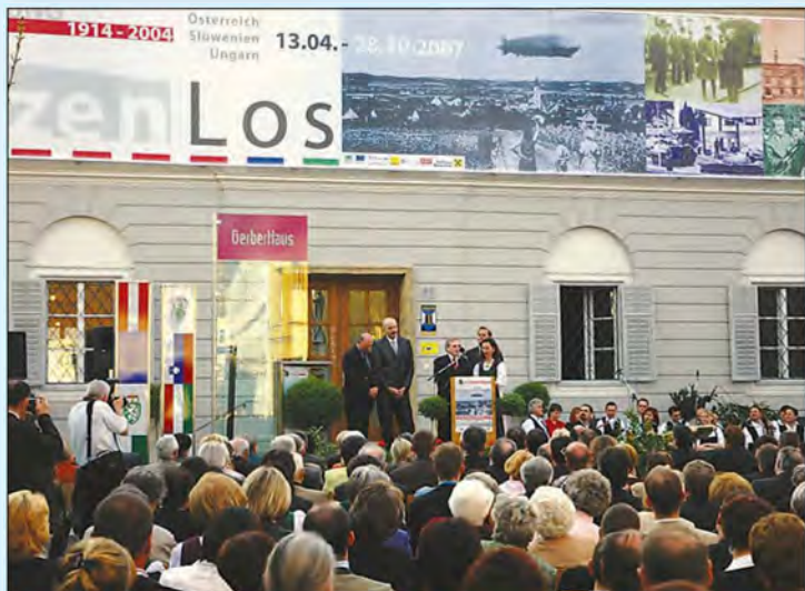
Otvoritev razstave v Fehringu - Gremzenlos 1914-2004 (Avstrija, Slovenija, Madžarska) - 13. april 2007