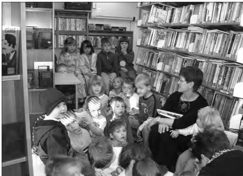
Poslušanje pravljice na bibliobusu

V dramatizaciji so nastopali otroci in vzgojiteljice, pri čemer smo sledili cilju razvijanja sposobnosti domišljiskega sooblikovanja in doživljanja