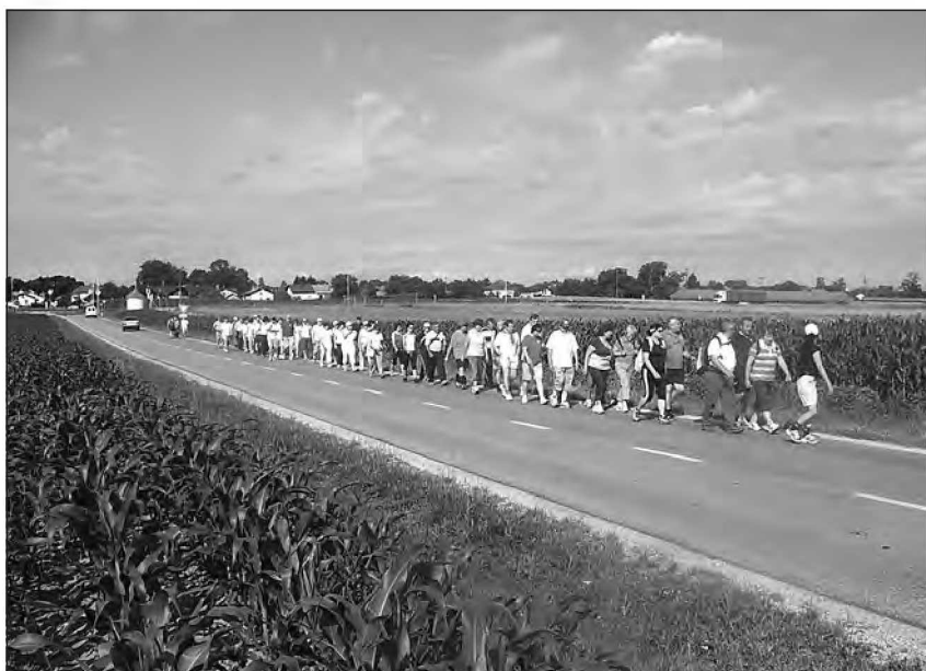
Po Ferijev ipoti

V spomin na nekdanj izvrstnega nogometaša in kasneje prizadev-