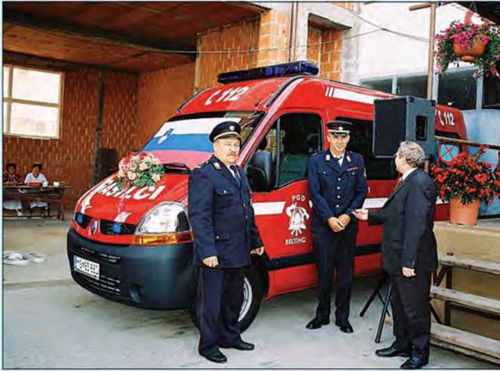
Prevzem gasilskega vozila PGD Beltinci - 4. avgust 2007