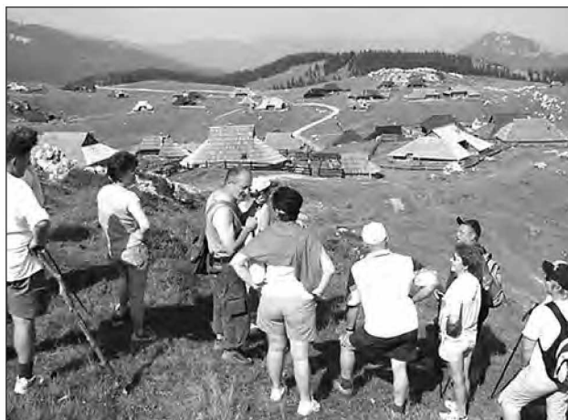
Velika Planina v vsej svoji lepoti