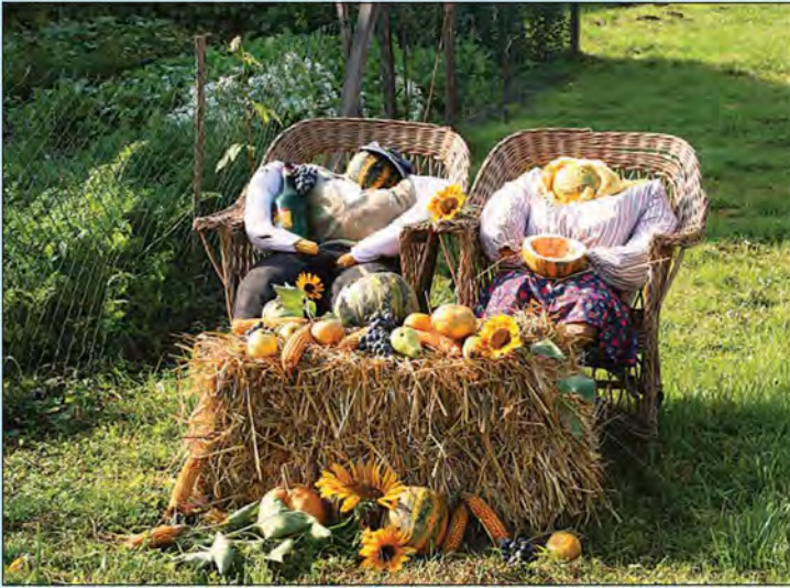
Praznik buč – pozdrav jeseni v Lipovcih – 19. september 2007