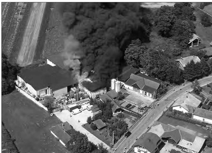
Požar tovarne biodizla v Gančanih

Ko poplavlja reka, ko veter podira drevesa, ko požar uničuje hiše, ko trčijo vozila..., vedno je pripravljen pomagati, priskočiti na pomoč - GASILEC. Pomagati sočloveku ob raznih stiskah je osnovna in temeljna naloga nas gasilcev, ki jo vestno in brez pomislekov opravljamo in izvršujemo tudi gasilci v Gasilski zvezi Beltinci, ki opravljamo svoje delo v okviru Zakona o gasilstvu ter v skladu z drugimi pravnimi akti.