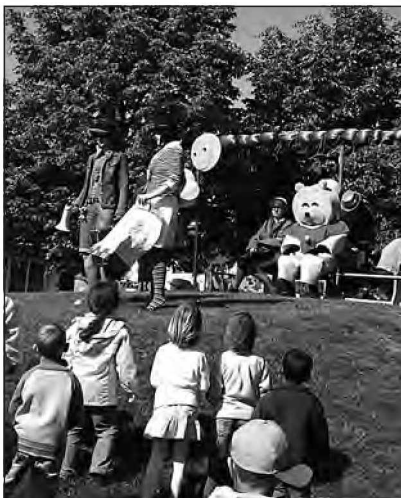
Detektivka tingula in pripravnik gumpo iščeta sodelavce za veliko detektivsko akcijo »biba ima 60 nog.

V vrtcu Beltinci smo se ob 60. letnici vrtca odločili našemu vrtcu pripraviti prav posebno "zabavo za rojstni dan". Slavili smo kar cel teden na treh prav posebnih prireditvah.