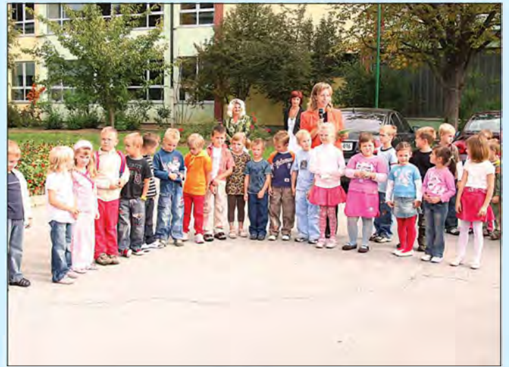
Prvič v šolo