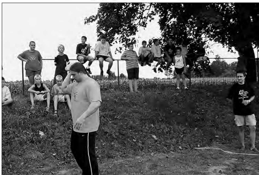
Zmagovalec v metu kamna