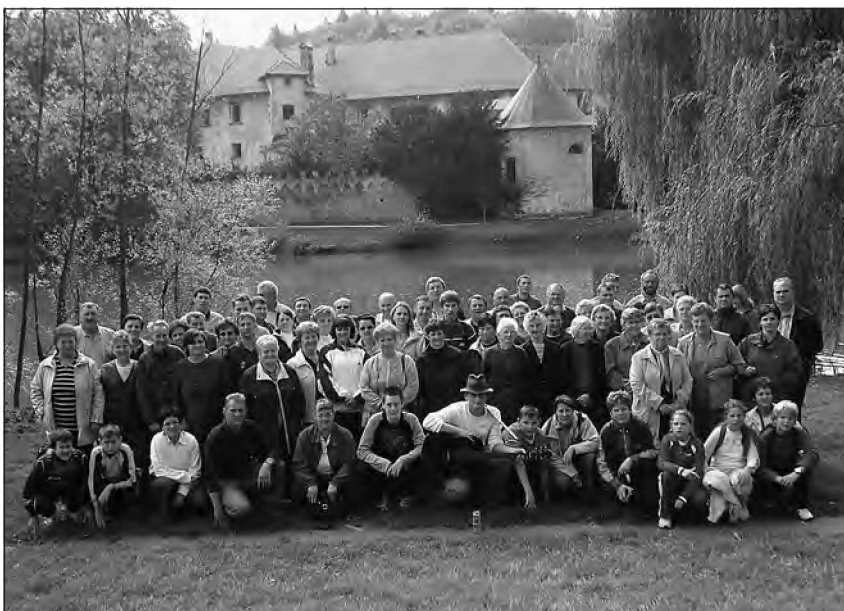
Udeleženci izleta na Dolenjskem

Mesec oktober je gotovo eden izmed najlepših jesenskih mesecev. To je čas, ko nas tudi narava, ki je odeta v najlepše odtenke zemeljskih barv, opominja in poziva k počitku. Tudi dela, ki jih je bilo treba postoriti na polju še pred zimskih počitkom, so počasi in povečini opravljena.