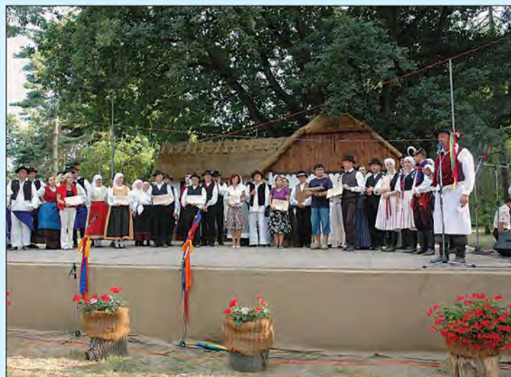
37. Mednarodni folklorni festival v Beltincih od 26. do 29. julija 2007