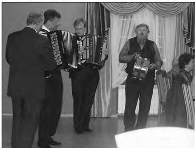
Poljski muzikanti so nas zabavali s svojimi vižami

Spoznati tako prijazne in družabne ljudi, kot so Poljaki, je enako, kot če bi občutil tla domačega Prekmurja.