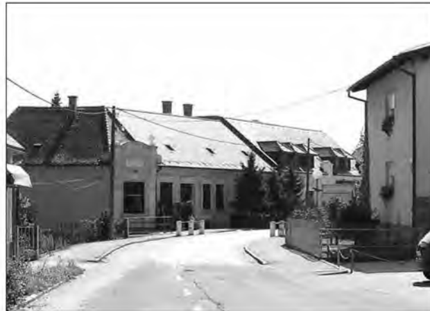
Hiša družine Prelog na mestu, kjer je nekoč stala sinagoga