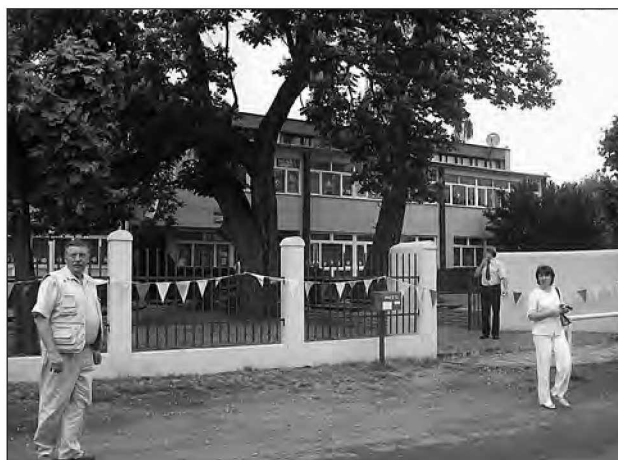
Nižja gimnazija v Blyzniju