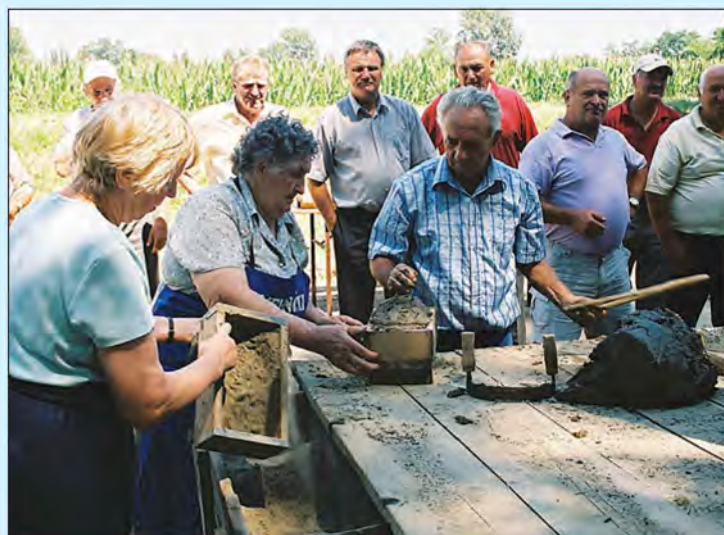
Tradicionalni Ciglarski dnevi na Melincih - od 6. do 8. julija 2007