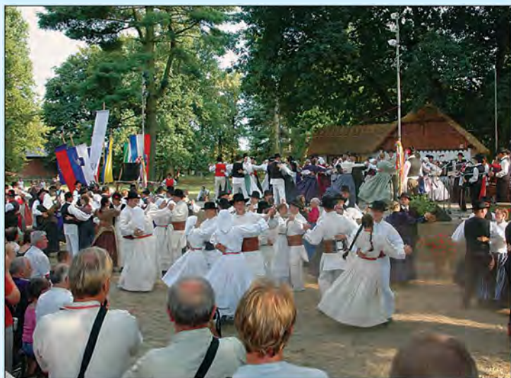
37. Mednarodni folklorni festival v Beltincih od 26. do 29. julija 2007