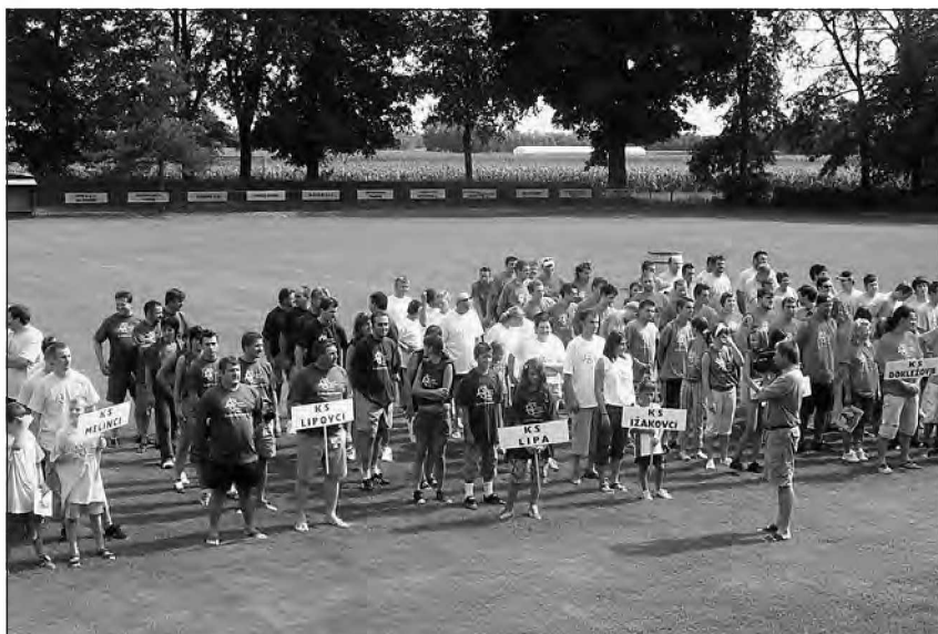
Ekipe na slovesni otvoritvi