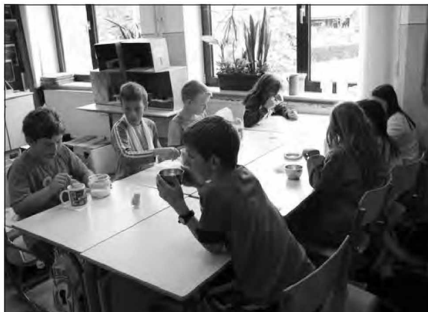
Angleški čaj ...

Ob zaključku nekega obdobja se ponavadi vprašamo, kaj vse smo storili, kaj se je spremenilo in ali smo bili uspešni. Šolsko leto je prehitro minilo. Vsaj meni se zdi tako.