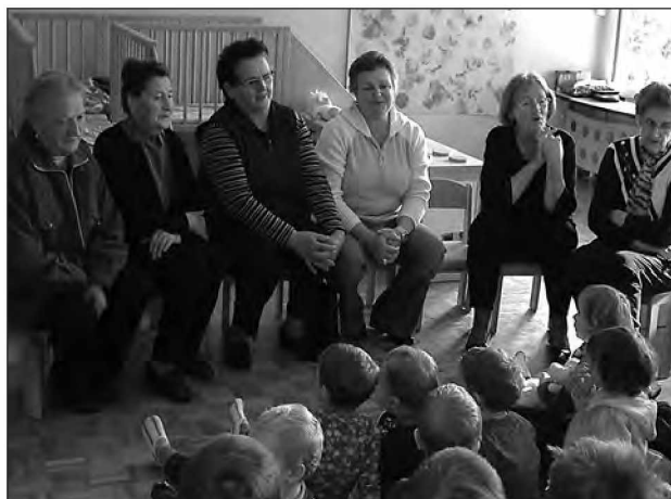
Pozorno smo prisluhčili babicam in dedkom