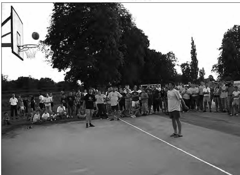
Pero pri metu na koš