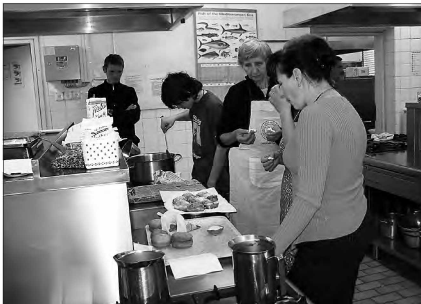
Slatni krofi iz brezglutenske moke

Več o delu društva in naše podružnice lahko preberete na http://www.drustvo-celiakija.si