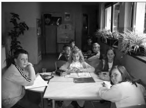
Učenje in branje