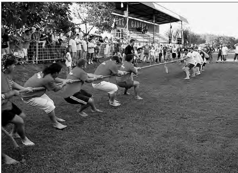
Močni fantje v akciji

Športne igre, ki se odvijajo vsako leto v drugi krajevni skupnosti, so s tem zaključile prvi krog. Prve igre so bile leta 2000 v Lipovcih, od koder je tudi prišla pobuda za organizacijo iger. Po tem, ko bile igre izvedene že v vseh vaseh občine Beltinci, bodo leta 2008 ponovno v Lipovcih.