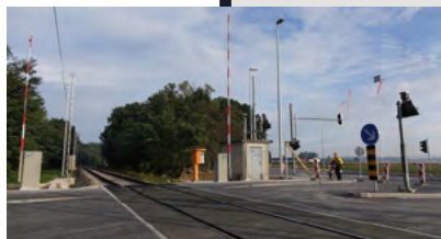
Nov nivojski prehod z urejenim višinskim profilom – omejevalcem višine.

Ob elektrifikaciji železniške proge med Pragerskim in Hodošem so se izvedle infrastrukturne posodobitve, na katere morajo biti še posebej