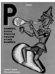
Vojtěch Mašek: Panáček, pecka, švestka, poleno a zase panáček . Ilustr. Chruďoš Valoušek. Baobab, (Praga, Češka).

Knjige za otroke in mladino se z vizualno podobo in oblikovanjem morda v zadnjih letih še bolj spogledujejo z digitalnimi sporočili in dokumenti. Zelo