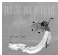
Jessica Love: Julian Is a Mermaid . Ilustr. avtor. Candlewick Press (Somerville, ZDA).