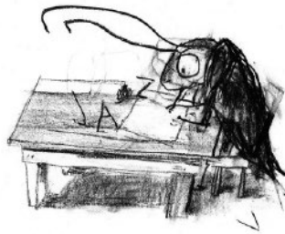
Ilustracija Ane Zavavlav

Na bolonjskem knjižnem sejmu je tudi množica različnih prireditev, srečanj z ustvarjalci mladinskih knjig idr. Doživeli smo zelo lepo srečanje z našo ilustratorko Ano Zavavlav, ki se je uvrstila na osrednjo razstavo ilustratorjev z ilustracijami iz knjige Toona Tellegena Čriček in temačni občutek (Mladinska knjiga, 2017). Srečanje sta vodili Špela Frlic in Renata Zamida.