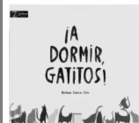
Bàrbara Castro Urío: ¡A dormir, gatitos! Ilustr. avtor. Zahorí Books (Barcelona, Španija).