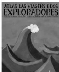
Isabel Minhós Martins: Atlas das viagens e dos exploradores . Ilustr. Bernardo P. Carvalho. Planeta Tangerina (Carcavelos, Portugalska).