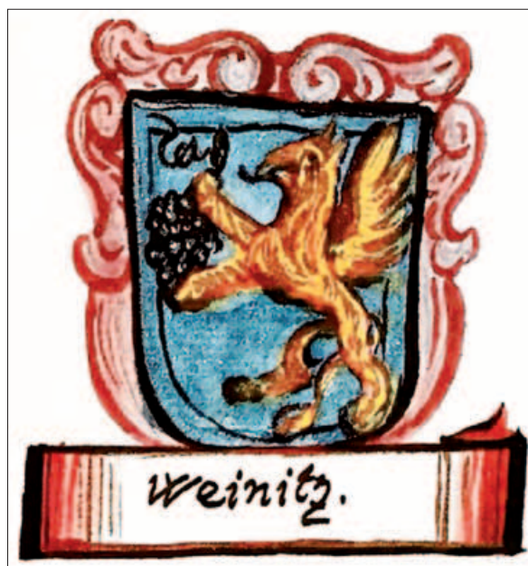
Grba rodbine Semenič in trga Vinica iz Valvasorjevega dela Opus Insignium Armorumque (1687–1688), fol. 153 in 27. Modro (azurno) polje grba Semeničev je najverjetneje botrovalo modremu polju v grbu trga Vinica.