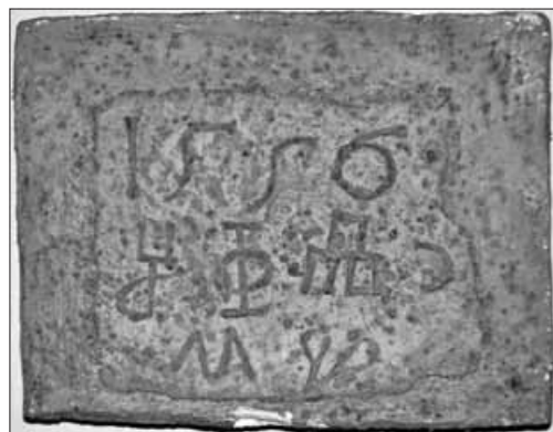
Napis v gotici (levo) in glagolici (desno) z gradu Vinica. Za fotografiji mavčnih odlitkov v brambi Belokranjskega muzeja Metlika se zahvaljujem Leonu Gregorčiču.

tvijo, da so Semeniči grad leta 1602 prodali rodbini Kanizar, ki ga je posedovala do leta 1653, ko je prišel v roke Purgstallom. 12