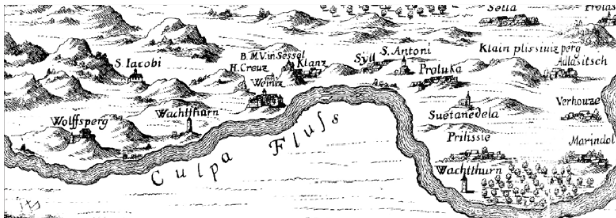
Segment Valvasorjevega zemljevida kranjskega Pokolpja, kjer so jasno vidni stolpi (Wachtturn), ki so jih konec 16. stoletja postavili ob ključnih prehodih čez Kolpo (Slava vojvodine Kranjske, 1689, III. knjiga, med stranema 304 in 305).