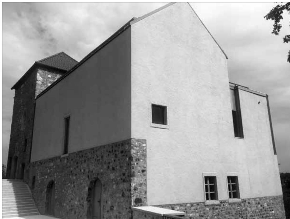
Severna in zahodna stran obnovljenega gradu Vinica, maj 2016.