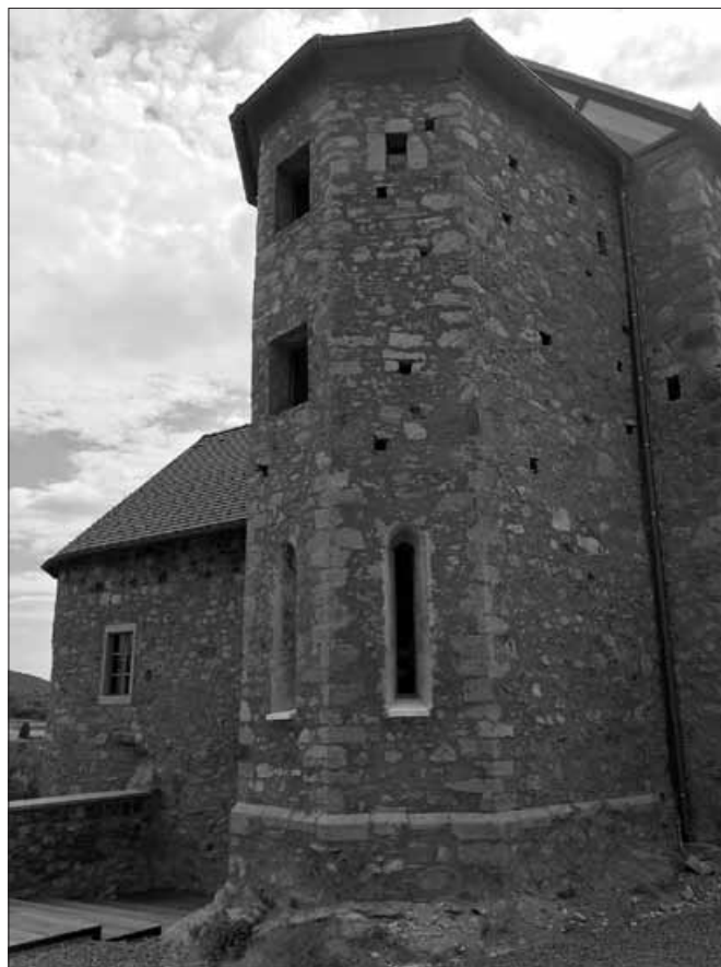
Vzhodna stran gradu s kapelo sv. Katarine, in južni stolp, obrnjen proti reki Kolpi, maj 2016.