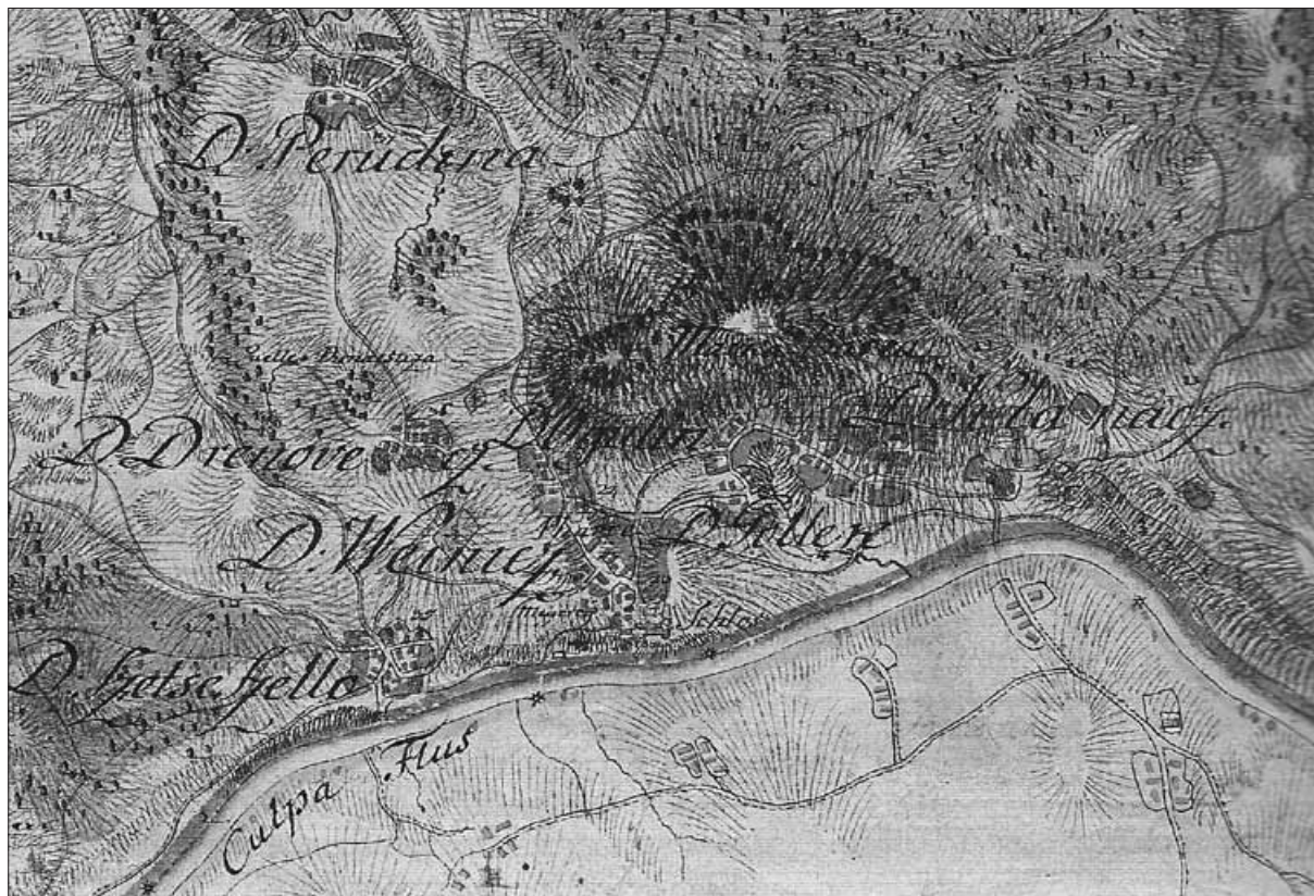
Vinica na vojaškem zemljevidu v letih 1763–1787. Očitni so obrisi nekdanjega trškega obzidja, tabora (Slovenija na vojaškem zemljevidu 1763–1787 1, izsek zemljevida 247C2).