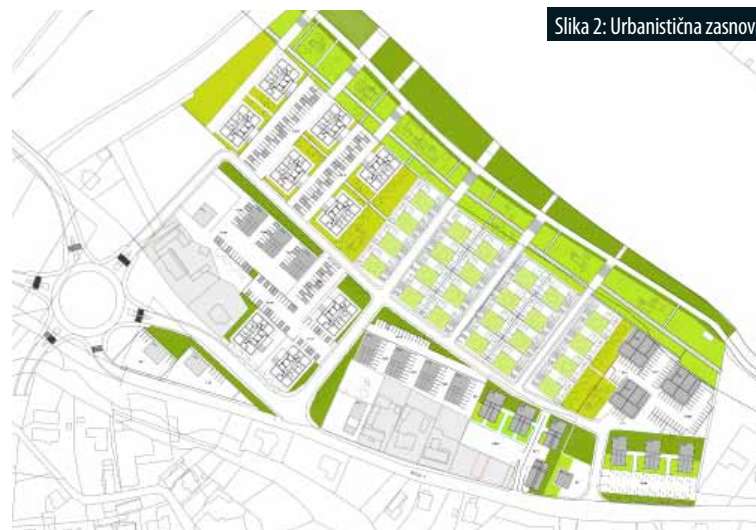
Slika 2: Urbanistična zasnova