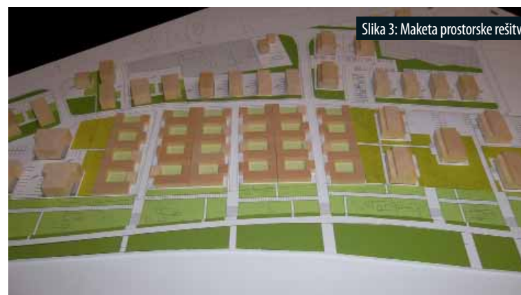
Slika 3: Maketa prostorske rešitve