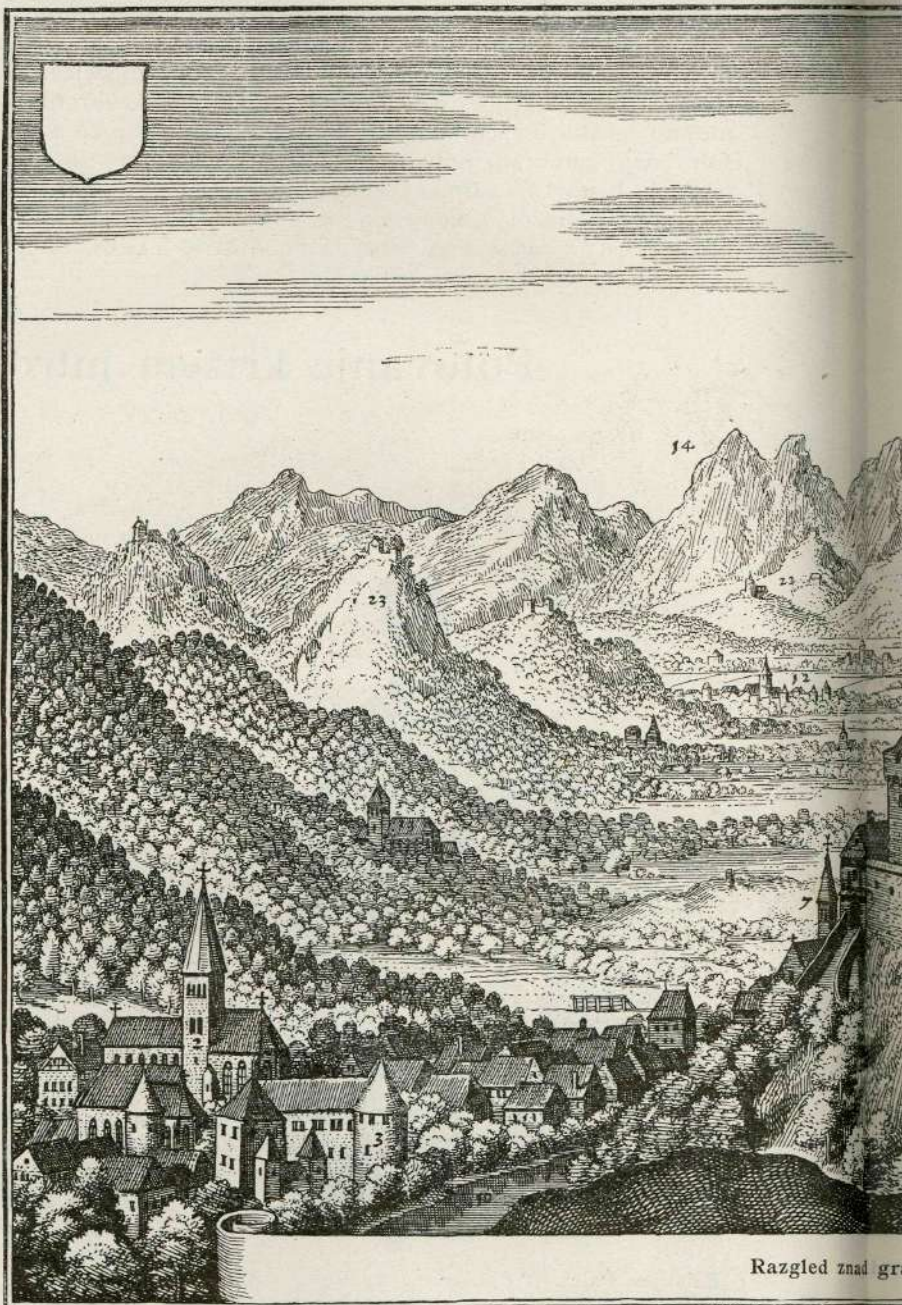
Razgled znad gr

Povedati namreč želi, kako mu je bilo na turškem poštnem vozu, v katerem se je vozil prvič po tej cesti od Jafe do Jeruzalema.