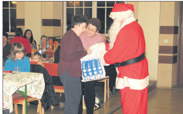
Božiček s svojim spremstvom je obdaril člane društva.

Člani si vsako leto privoščijo tudi izlet. Letos je bil to dvodnevni izlet v terme Zreče in na Roglo. Še posebej jim je vsem ostalo v spominu, da so samo za njih pogнали adrenalinske sani, na katerih so zares uživali. Priljubljena dejavnost so tabori