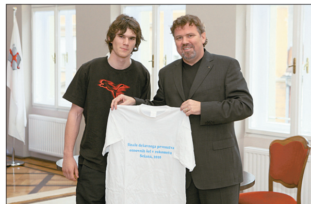
Sprejem v ptujski Mestni hiši za državne šolske prvake v rokometu, ekipo OŠ Ljudski vrt