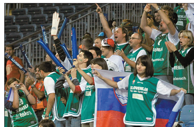
Košarkarski navijači so avgusta množično drli na SP v Turčijo.