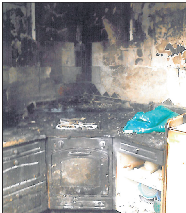
Od prejšnjega stanovanja ni ostalo nič.

V celoti je obnova stala 70 tisoč evrov. Nekaj je prinesla zavarovalnica, da ima mlada družina ponovno svoje stanovanje, pa so morali najeti kredit. Trenutno so sicer še brez