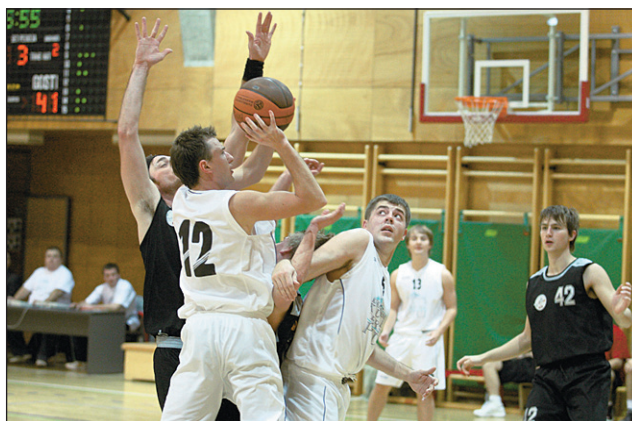
Ptujška članska košarka je v sezoni 2010/11 znova oživila; košarkarji KK Terme Ptuj nastopajo v 3. SKL - vzhod.