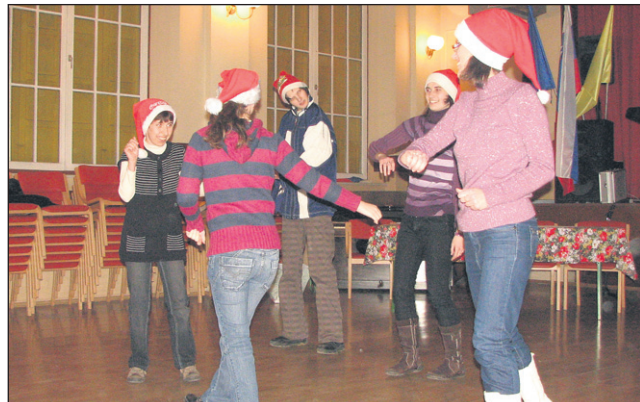
V programu so z božično točko nastopile tudi učenke OŠ Stanka Vraza.