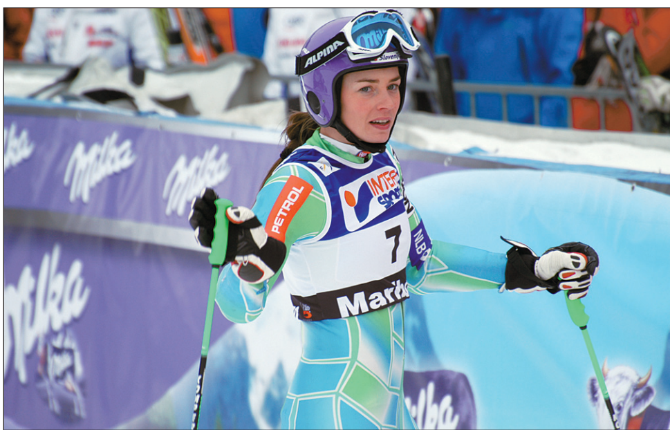
Tina Maze nas je februarja razveseljevala na ZOI v Kanadi; osvojila je dve srebrni medalji.