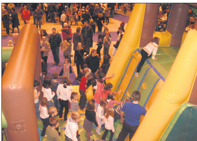
Najbolj razigrani in drzni so počenjali vratolomno akrobacije v napihljivi džungli športne šole Juhuhu.