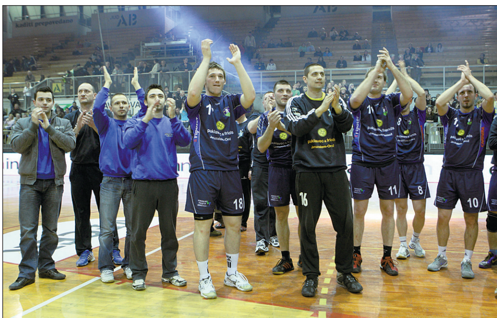
Rokometaši Jeruzalema Ormož so marca nastopili na pokalnem finalu najboljših četverice.