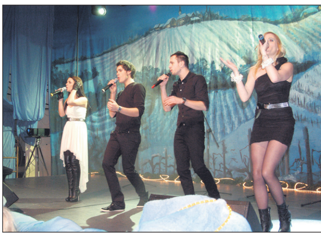
Med nastopajočimi je bila letos tudi popularna skupina 4play.