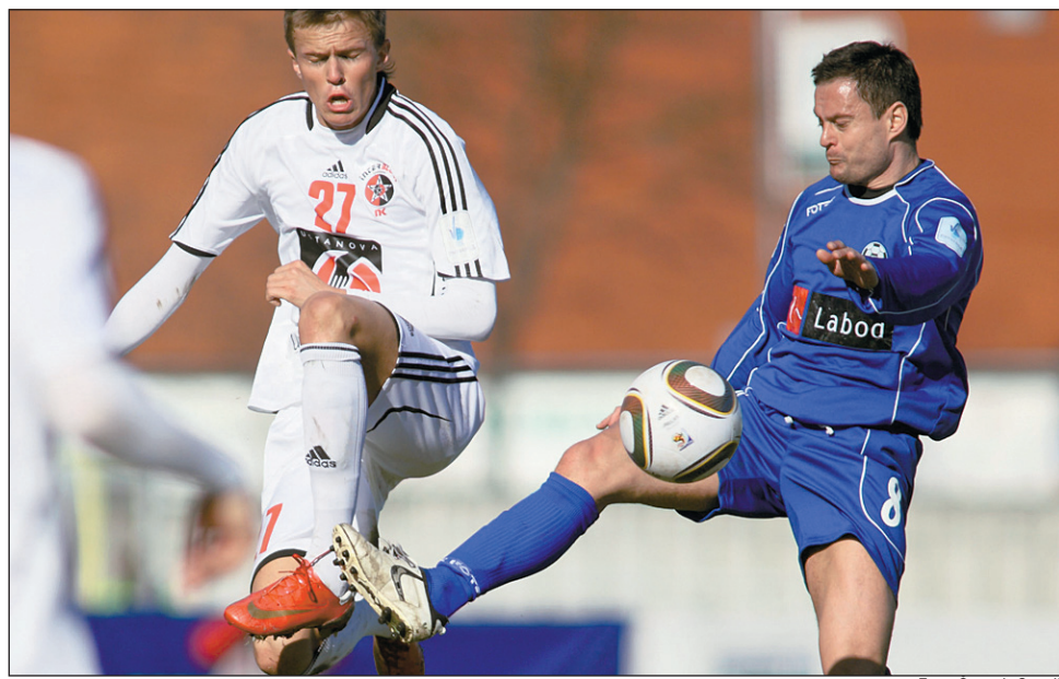
Nogometaši Laboda Drave so v sezoni 2009/10 izgubili status prvligaša.