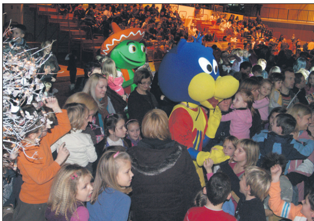
Malčki v dvorani so z navdušenjem sprejeli razigranega Juhija in poskočnega Poncha.