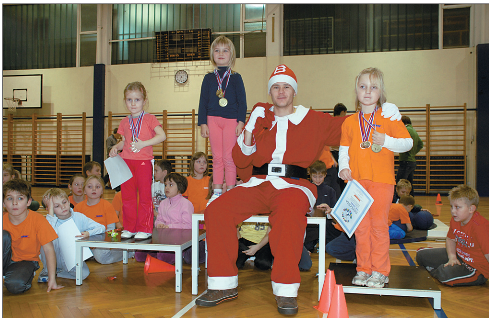
Mladi atletski naraščajniki so se družili in tekmovali z Božičkom.

»Cilj tekmovanja je druženje z obilo dobre volje, zadovolj-