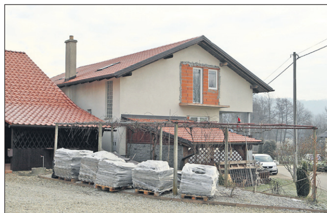
Mansardo, v kateri je stanovala mlada Erhatičeva družina, je bilo potrebno v celoti obnoviti.