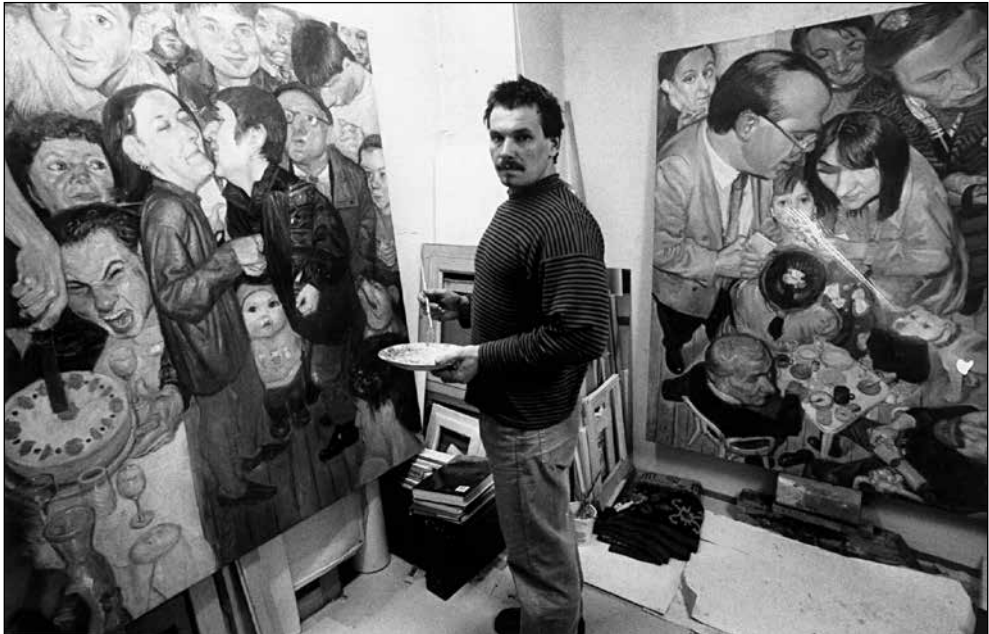
V svojem ateljeju.

"Zame je slikanje igra in garanje ter hkra- ti tudi sprostitvev in resno delo. Vse dam v sliko in z njo vse povem. Vsakdo lahko v mojih slikah najde svoje sporočilo, ker go- vorijo same zase. Oglejte si jih! Slikam iz- ključno zaradi slik."