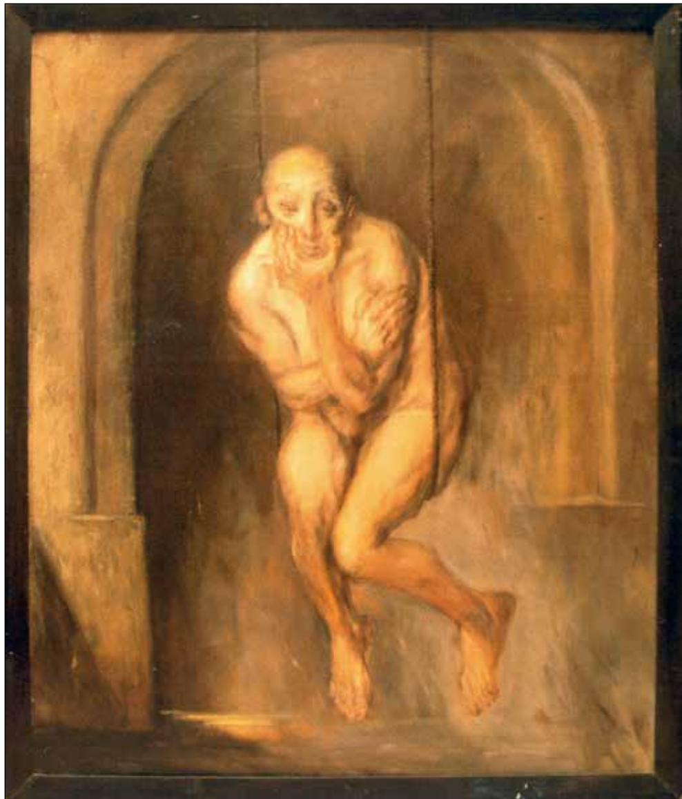
Rjavo obdobje: Sam, 1991, olje na platno, 150 x 130 cm.

Različno. Včasih gre zelo gladko, drugič ne, ker se slika ne pusti ujeti. V procesu nastajanja se s sliko kregava, vpliva name, se boriva ..., barve nanašam in praskam, pa spet dodajam, prekrivam, plastim ... Res me zahteva v celoti. Nikoli ne vem vnaprej, kako mi bo delo šlo izpod čopiča. Včasih se zgodi, da mi slika ne uspe, z njo nisem zadovoljen in potem moram začeti znova.