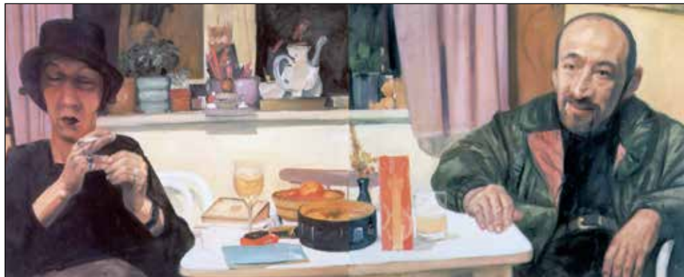
Kva pa misl'š?, 1989, olje na platno, 100 x 260 cm, v lasti Factor banke.

Najraje slikam pri dnevni svetlobi, tako da največ ustvarim dopoldne, ko sem sam doma in je v hiši mir.