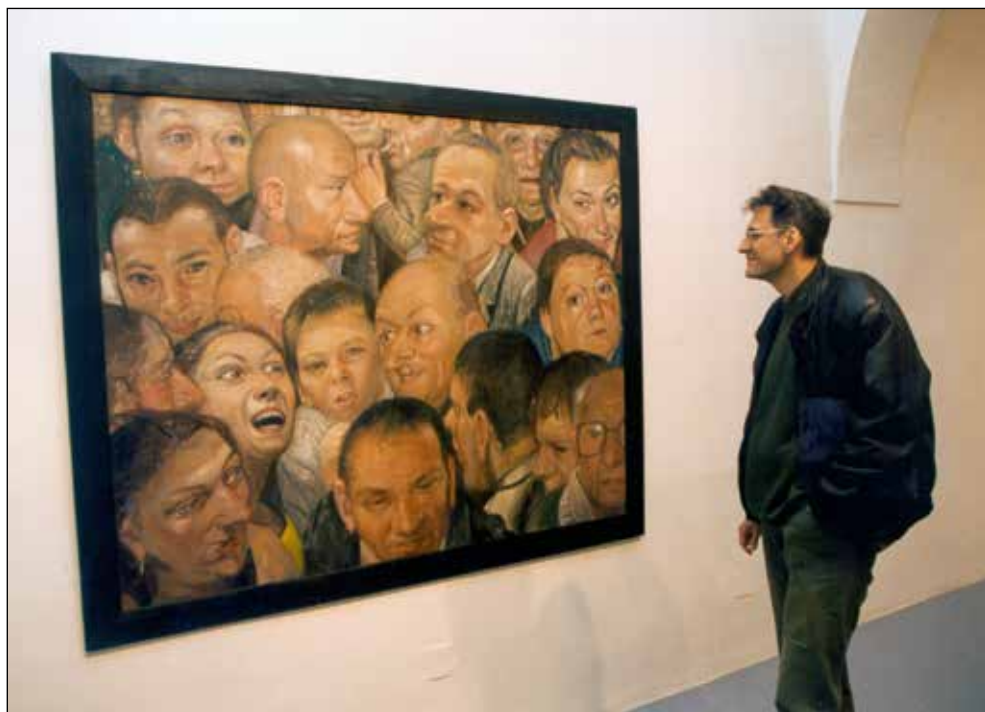
S samostojne razstave v Equrni, 1997.