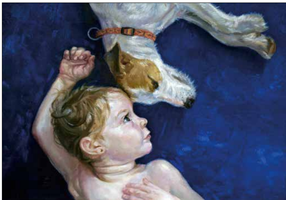
Prijateljja, 2008, olje na platno, 60 x 80 cm.