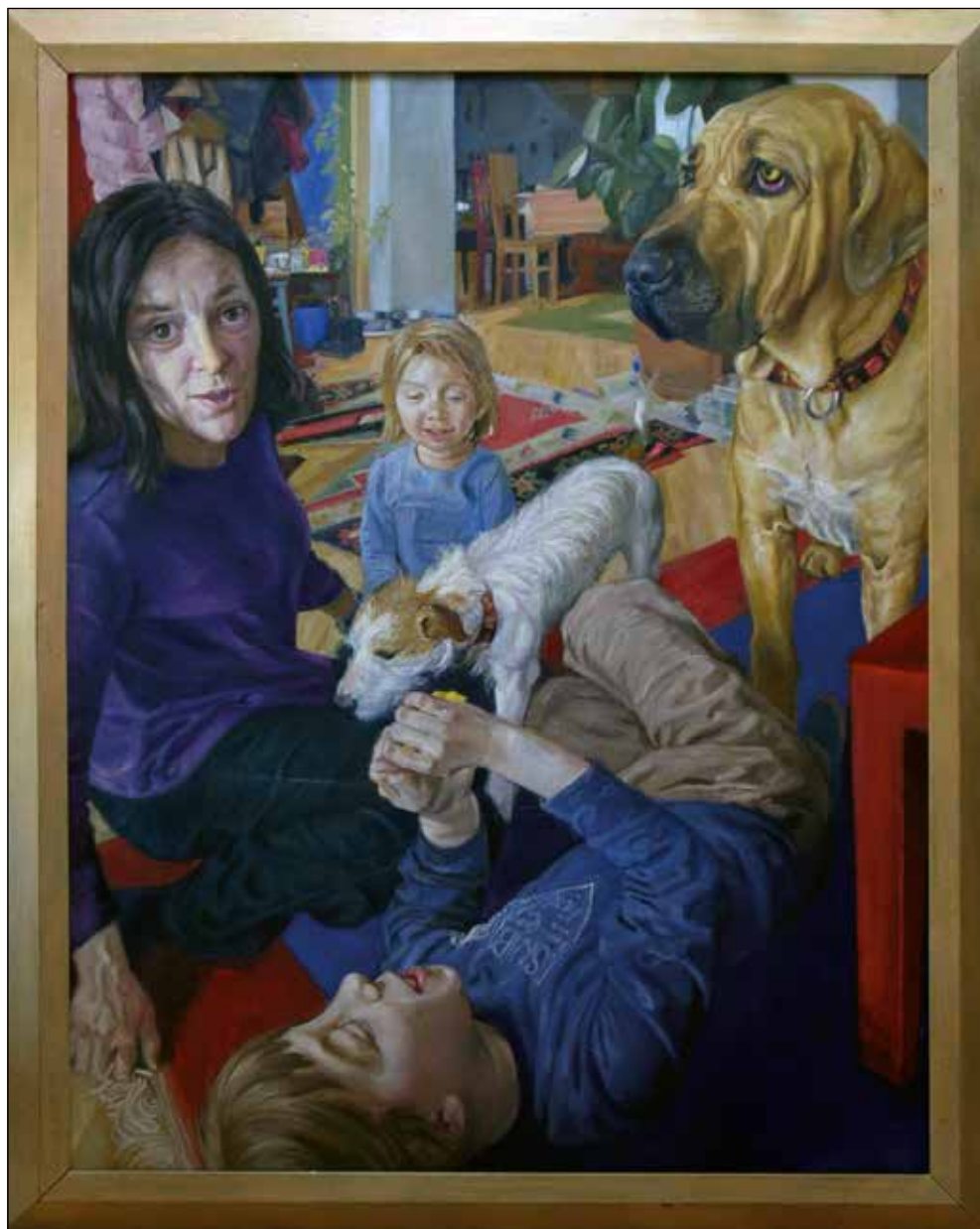
Doma, 2007 – 2008, olje na platno, 180 x 140 cm.