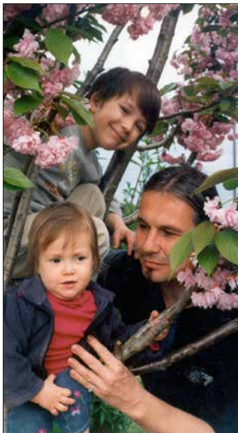
Predan oče.