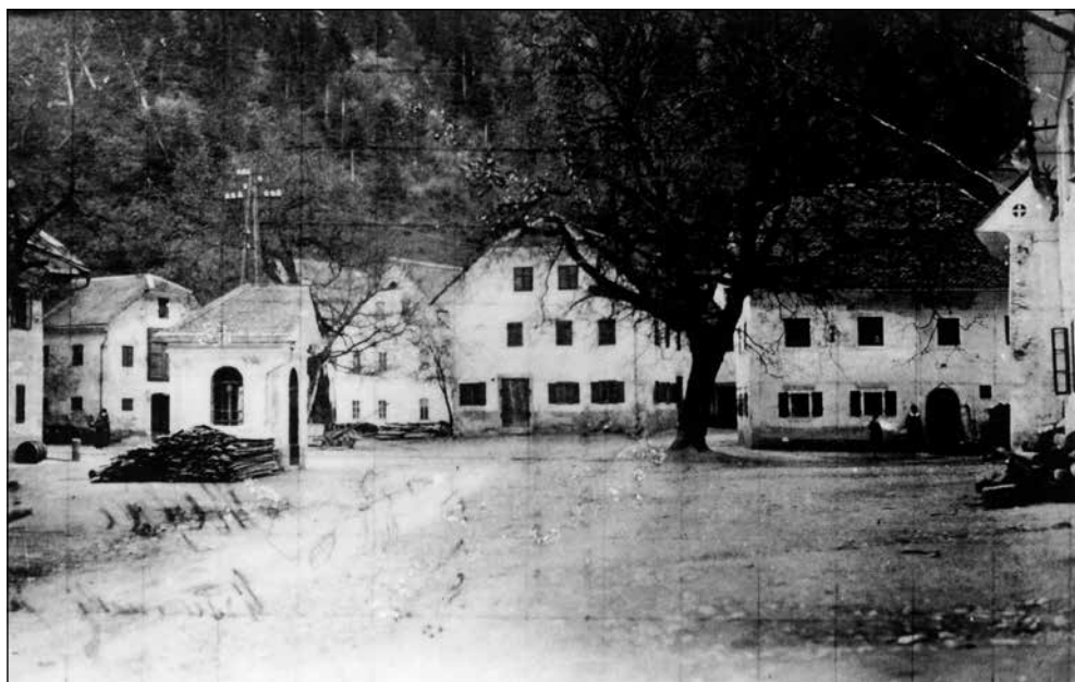
Na logu v Železnikih.