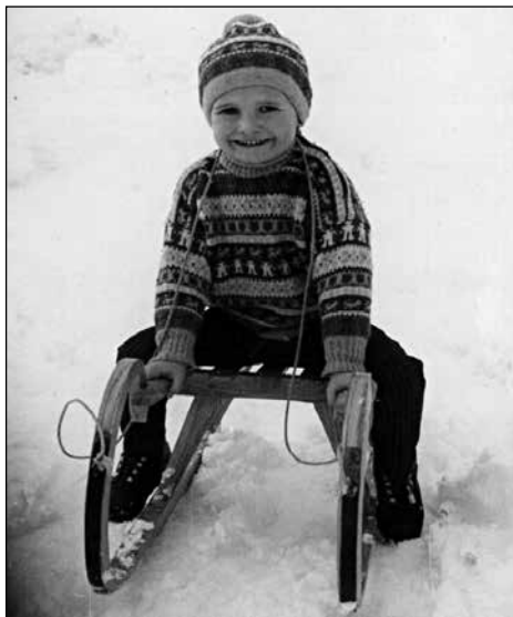
Zimske radosti.