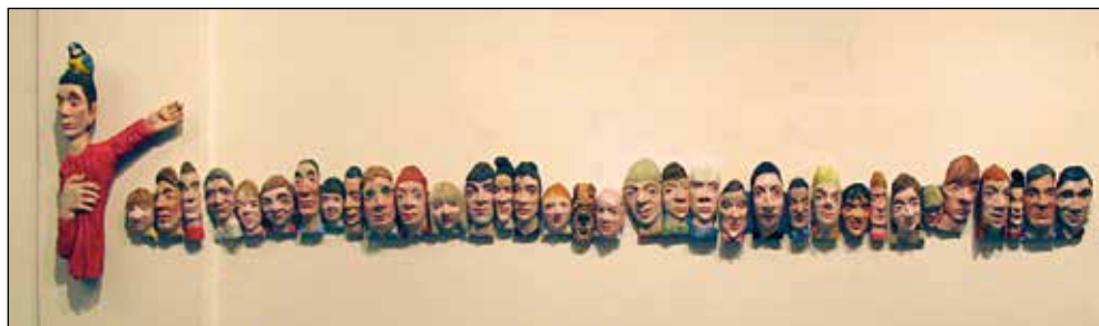
Lesene glave, rezbarije, 2006 – 2008.

Zaustavim se pri umetnikih, ki so se v svojih stvaritvah ukvarjali s podobnimi ali celo enakimi problemi kot jaz. Tudi mene zanima portret, človek in oni so bili tisti, ki so bili na tem področju najboljši,