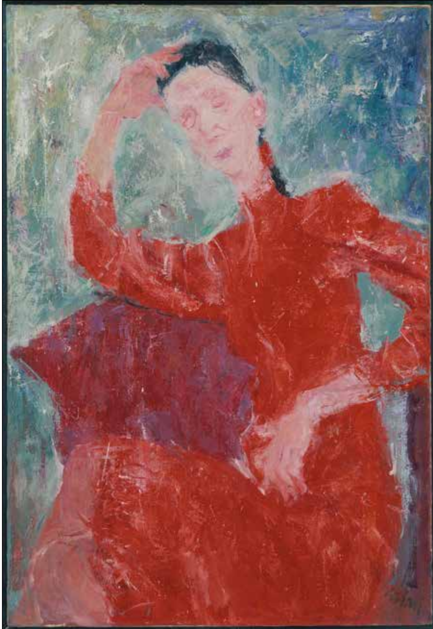
Diplomsko delo: Portreti, 1990 – 1991, olje na platno.