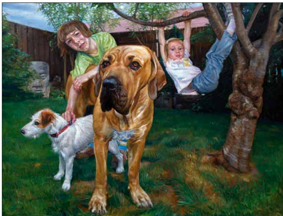
Drevo, 2007, olje na platno, 120 x 150 cm.