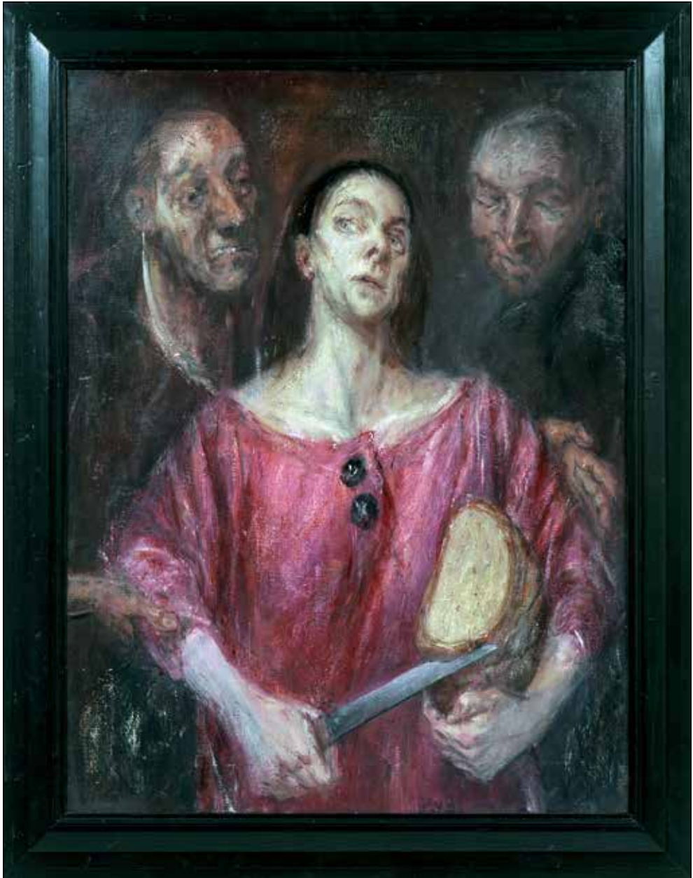
Diplomsko delo: Portreti, 1990 – 1991, olje na platno.