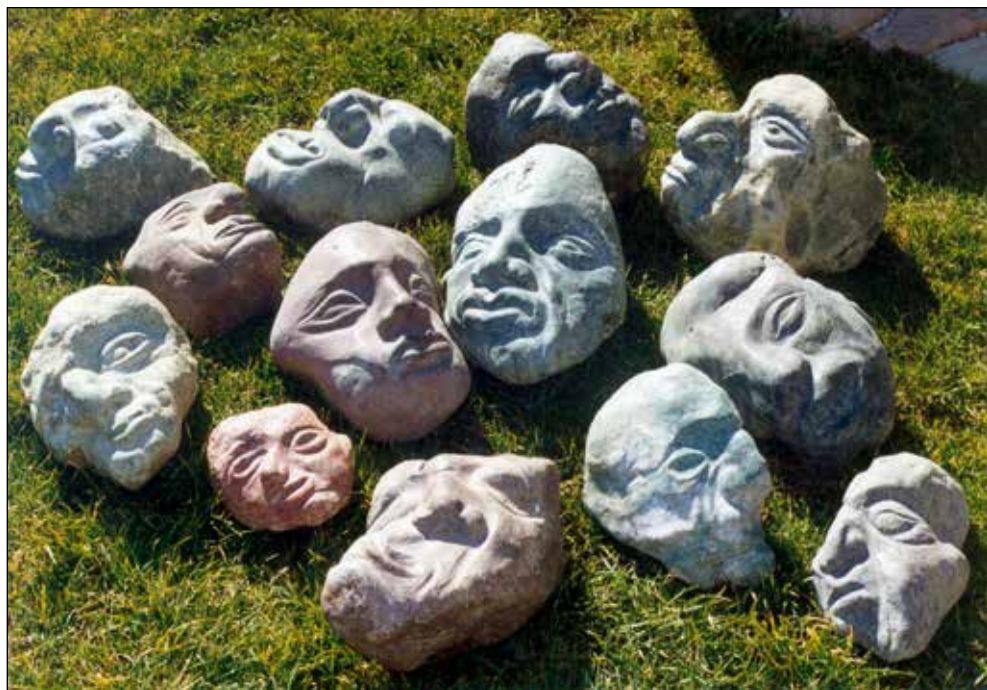
Nagrada Majskega salona, 1998, Kipci iz savskih rečnih kamnov.

Sprva sem kiparil iz gline, to je bilo še na akademiji. Potem pa sem želel s kamni iz Save tlakovati dvorišče pred hišo. Pri iskanju primernih kamnov sem našel tudi take, ki jih je reka že toliko oblikovala, da sem samo še dokončal njeno delo in nastali so obrazi. Trenutno izdelujem kipce - obraze iz lipe, ki jih tudi pobarvam.