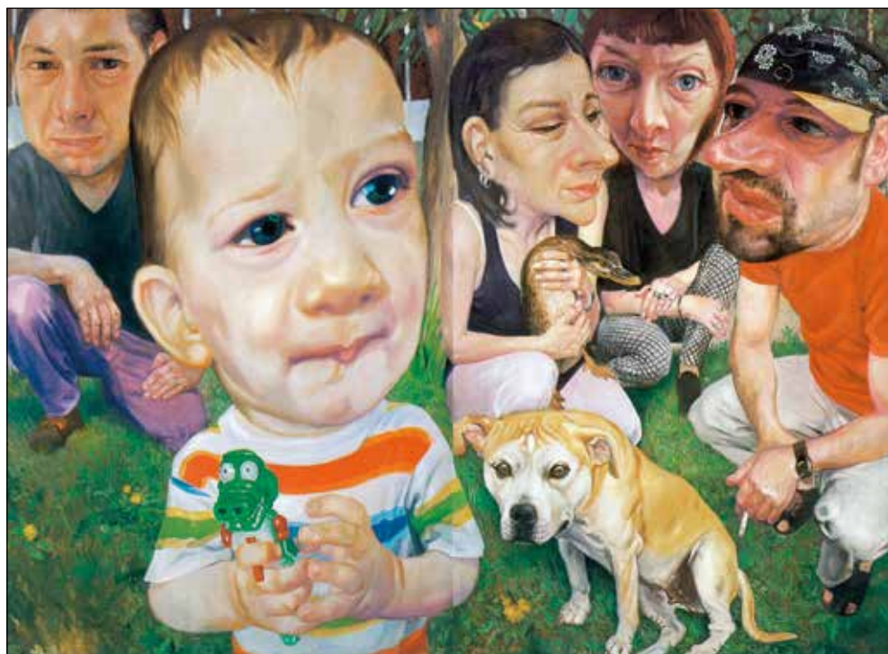
Moja Afrika, 2002, olje na platno, 200 x 280 cm.