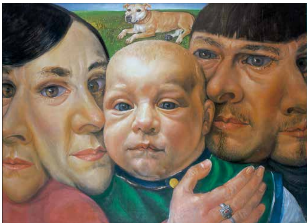
Družina, 1999, olje na platno, 140 x 200 cm.