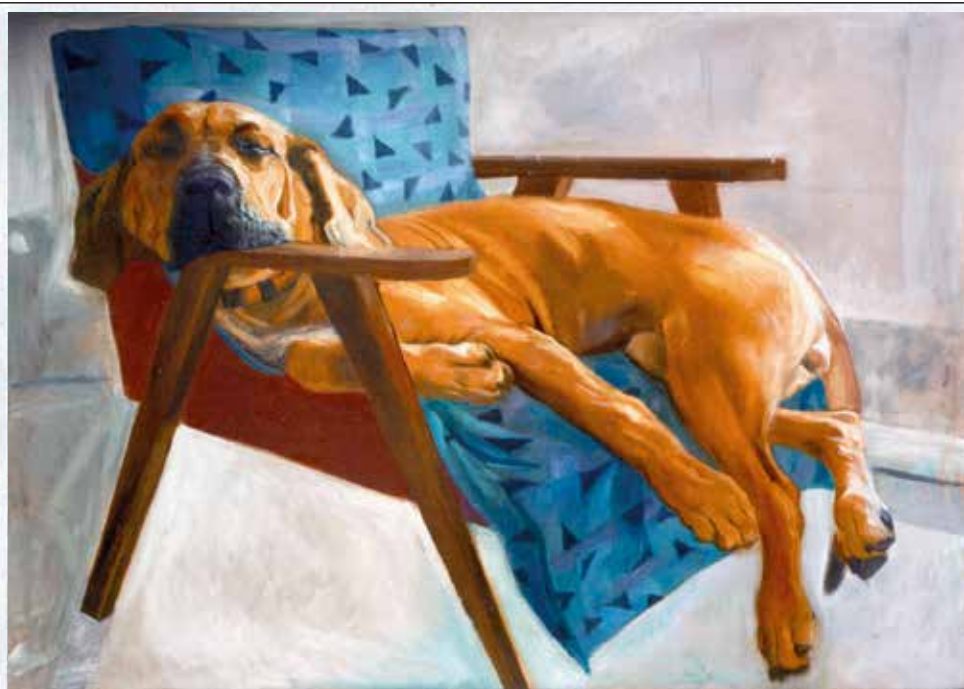
JURIJ KALAN, NAŠA KOBILA, OLJE/PLATNO