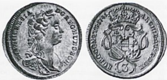
Neustavljivi šarm srebrnikov (groš iz leta 1741) (v: Von Pfennig zum Euro. Geld aus Wien, Wien 1998, str. 122).

eliti zdele najbolj nemoralne. Tako se iz obravnavanega sodnega protokola zrcali več v različnih diskurzih tipičnih podob zločinca. Skozi opise tatvin se je potrjevala takšna podoba Matevža Kavčiča, kakršno je hotel ustvariti sodnik. Matevž je postajal zvit tat. Tat pa je postal zaradi svojega nemoralnega 14 življenja kot pijanec 15 in strastni igravec iger 16 na srečo. Popivanje in igranje hlapcev je bilo pri mestnih oblasteh zelo slabo zapisano in pojmovano kot zelo nemoralno. Uveljavilo se je kot glavni vzrok kraj mladih neporočenih mož. Igralci iger na srečo kot tipično moški hudodelci so v tem času, podobno kot prostitutke v tipično ženskem prestopku, veljali za upornike družbenemu redu. 17 V skupnosti, kjer so hudodelca predstavili javnosti, je morala biti usmrtitev zgled. Vsak trenutek je morala pokazati, kakšno »zasluženo plačilo« čaka ljudi, ki so živeli nemoralno, in temu cilju je bila podrejena retorika prebranega priznanja. Podoba je morala nagovarjati zbrano množico, 18 torej prebivalce predmestij in predvsem hlapce ter dekle, ki so