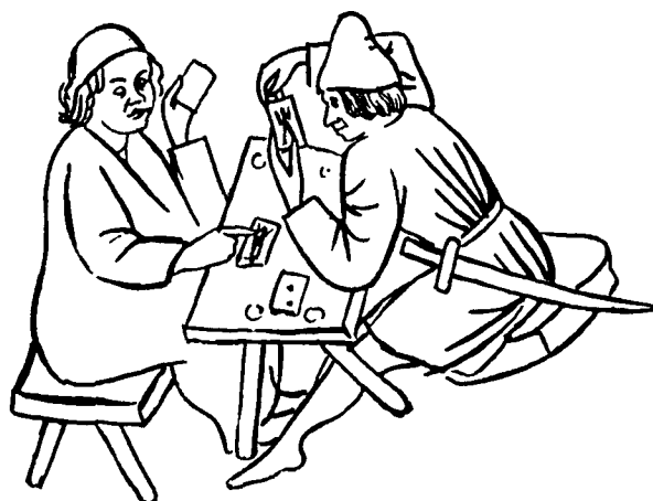
V kvartopirski družbi je Matevž »porabil« ukraden denar (Ilustracija v: Josip Mal, Stara Ljubljana in njeni ljudje , Ljubljana, str. 19).

Poleg takoj opaznih oblikovnih razlik se ob natančni analizi vsebine sodnih protokolov pokažejo velike socialne in kulturne razlike med sodnikom in preiskovancem. Prvemu so bili bolj domači le načini kraj in indici, ki jih je poznal iz normativnih predlog. Takšne trditve se ne opirajo zgolj na ugotovitve drugih raziskovalcev, 9 ampak so vidne tudi v obravnavanem viru. 10 Najprej padejo v oči pri opisovanju ukradenega blaga. Tako je ljubljanski sodnik za ponošeni moški suknjič iz blaga deželne suknarne v Ljubljani v protokol ob zapisu, da je bil prodan skupaj z dvema kriloma iz mezlana 11 za 10 goldinarjev, poudaril, da je bil samo suknjič vreden toliko. K opisu je izpraševalec, ljubljanski mestni sodnik Joseph Hueber von Huebenfeldt, očitno pridal osebni pečat. Poleg tega, da je bil že nekaj časa član notranjega mestnega sveta, je namreč svoje premoženje kopičil s prodajo sukna. 12 Sukno je kot človek, ki se je spoznal na stvar, ocenil brez izjave priče. O dejanski vrednosti na kmetih stkanega v črno pobarvanega platna pa se mu ni niti sanjalo. Čeprav ga je Matevž tako kot drugo ukra-