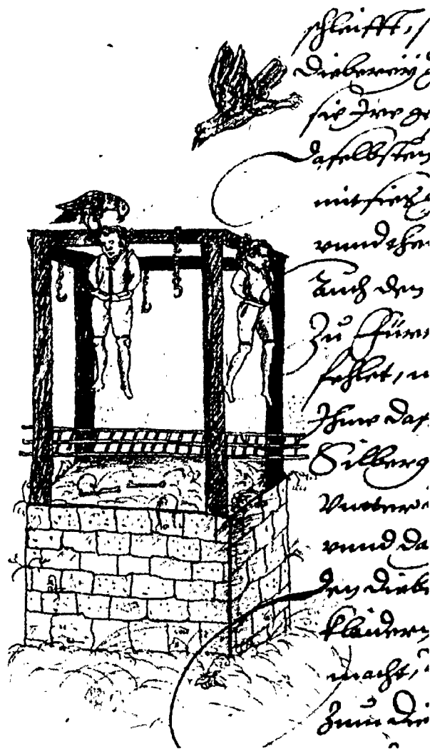
In njegovo truplo je moralo obviseti drugim za zgled (v: Recht und Unrecht. Kriminalität und Gesellschaft im Wandel von 1500 - 2000 , str. 150).