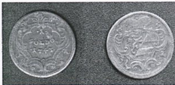
Sold je bil dar beraču, ki je šel za rujno vince.

Ljudje so bili najbolj darežljivi ob praznikih. Pri Leskovcu v Poljanski dolini je na vse svete (1. 11.) prosil za mile darove in se izdajal za pogorelega, 109 človeka torej, ki mu je vse premoženje pogorelo. Na praznični dan je lahko na vrata potrkal prej kot običajno in ni se mu bilo treba bati, da bi ga od hiše pregnali. Beračenje je bilo uspešno le, če je berač »premogel« kakšen potreben rekvizit, na primer ponarejeno potrdilo, 110 da mu je ogenj uničil premoženje. Z ukradenim denarjem bi lahko ponarejeni listek kupil na poti ali v kateri od gostiln. Nepismenim kmetom je bilo namreč dovolj, da ga je zgolj pokazal. Najverjetneje pa je Matevž imel palico, najbolj prepoznavni znak beračev. 111 Tako pogost, da je tudi Valentin Vodnik v svojem Dramilu zagrozil, češ, lenega čaka »pal-