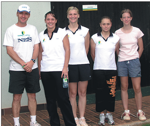
Ekipa TK Nes Ptuj je letos ponovila lanskoletni dosežek - osvojila je 3. mesto v državnem ekipnem prvenstvu.