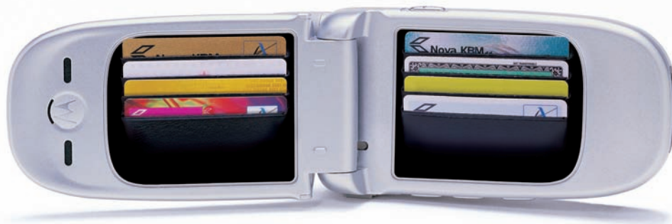
Nova KBM d.d., Ulica Vite Kraigherja 4, 2505 Maribor

Zabavajte se in prihranite. Z Moneto lahko na prodajnih mestih Festivala Lent plačujete z 10% popustom. Hitro, varno in enostavno. Ker imate mobilnik vedno s seboj, lahko denarnico pustite doma. Z Moneto lahko plačujete Mobitelovi in Debitelovi naročniki GSM/UMTS ter uporabniki Monete Nove KBM.