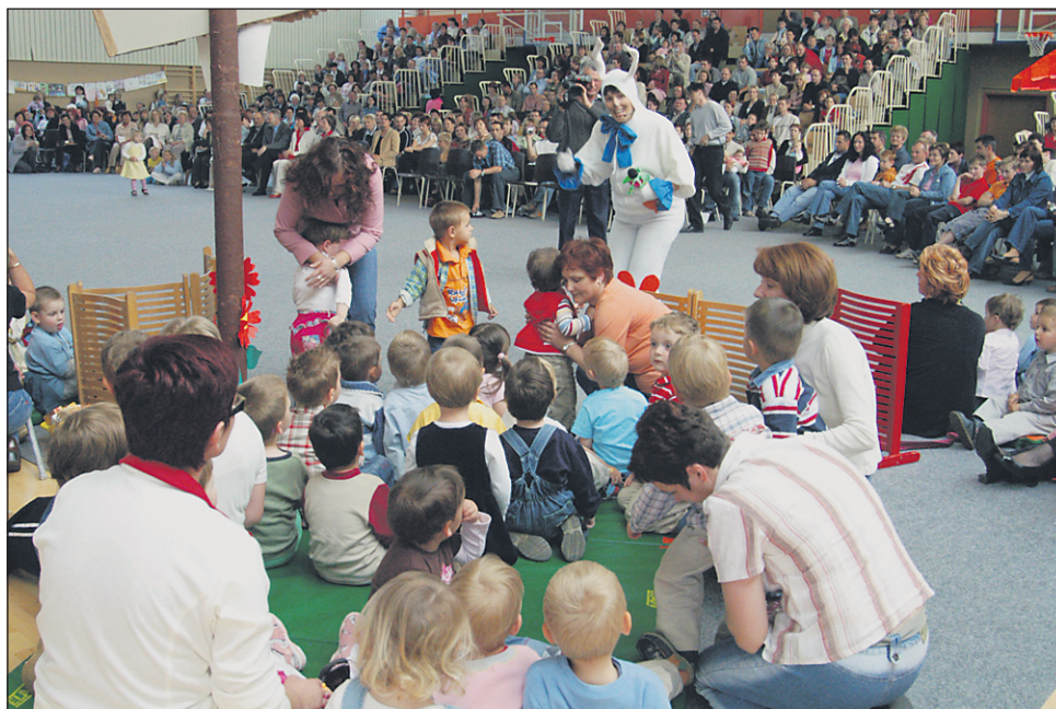
Malčke in goste v dvorani je skozi svet glasbe in instrumentov nadvse zabavno popeljal zajček Dopetajček .