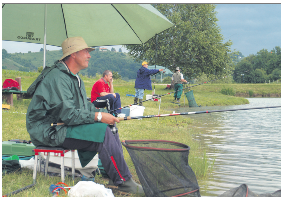
Ob ribniku v Podlehniku je namakalo trnke 67 policistk in policistov z območja PU Maribor.

Zbrali so se nekaj pred osmo uro zjutraj in po žrebanju startnih števil obkrožili ribnik ter kmalu začeli krmiljenje rib ter namakanje urah so nekateri dokazali, da znajo loviti tudi prave