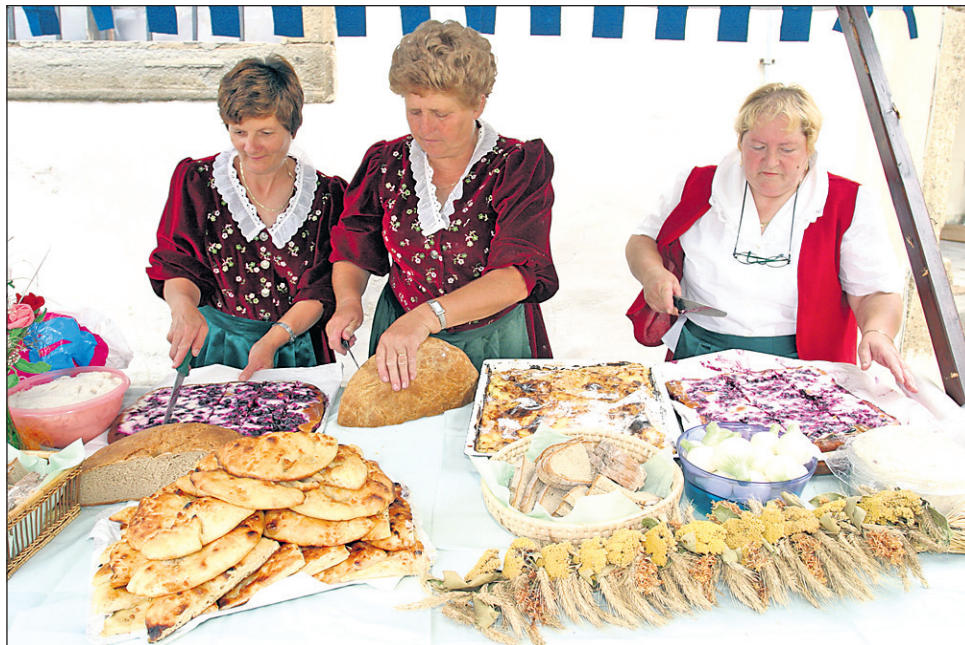
Domače dobrote na stojnici Društva gospodinj Juršinci