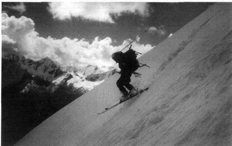
Sprva je bilo zelo težko, potem napeto, na koncu sproščujoče.