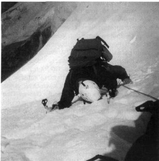
102 Kratek počitek z glavo v snegu.