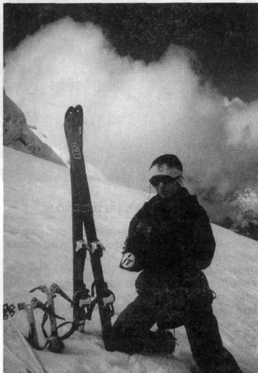
Od tukaj je šlo potem navzdol kot namazano.