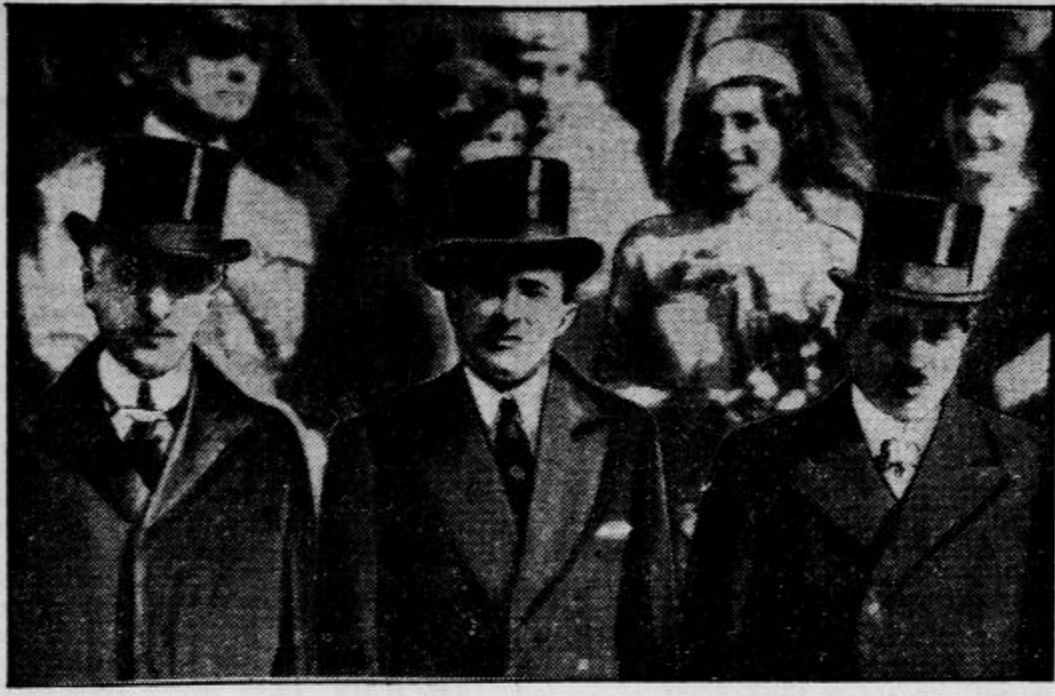
Edina radio slika o Lavalovem prihodu v New York. Od leve proti desni: ameriški državni tajnik Stimson, newyorški župan Jimmy Walker in predsednik Laval