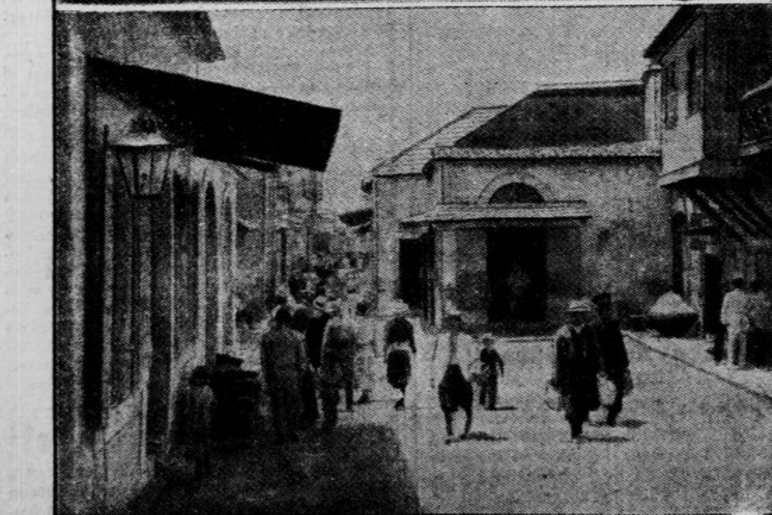
Zgoraj pristanišče v Larnaki z vladnim poslopjem (puščica), ki so ga uporniki zažgali. Spodaj glavna cesta v mestu Limassol