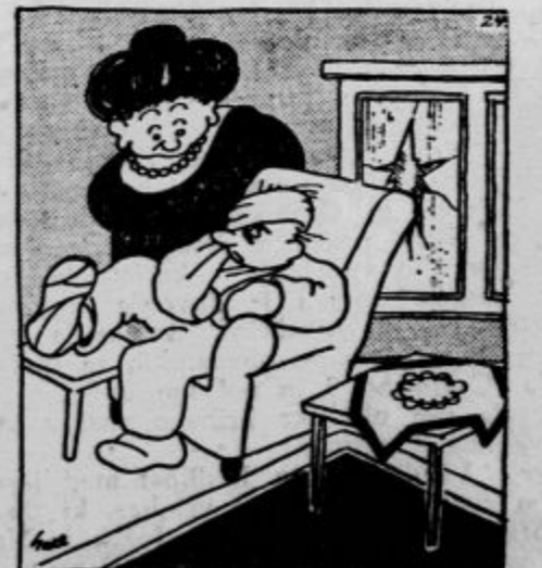
»Razmišljal sem o najinem večeršnjem spopadu... morda si imel pa le prav...«