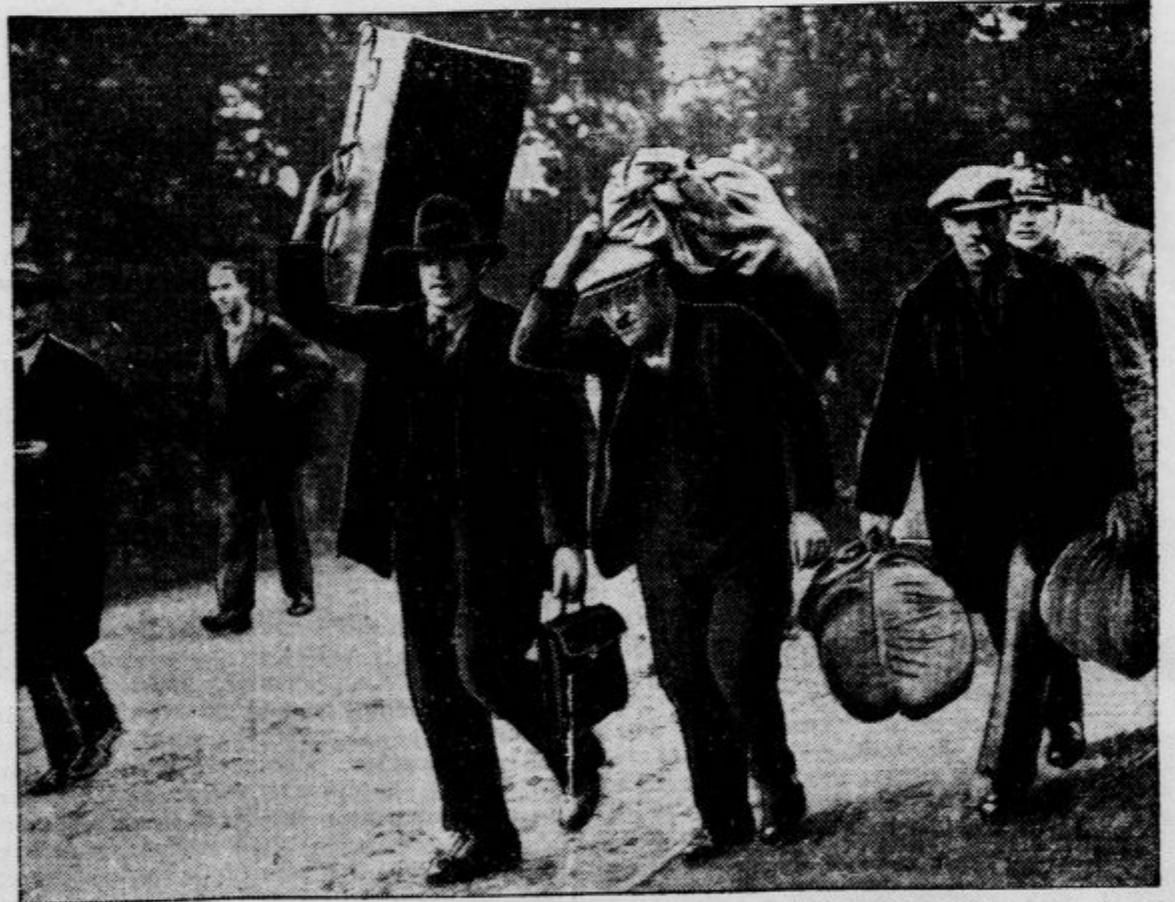
Moštvo nemških bojnih ladij, ki je bilo organiziralo v ruskih pristaniščih upor, je ob njih povratku v Kiel obkolila policija in ga odpeljala pred preki sod v Kiel-Holtzenau