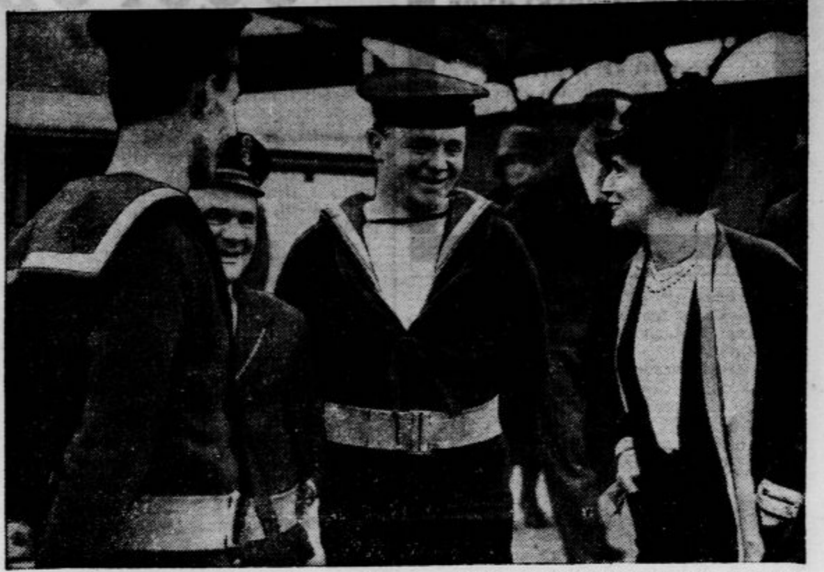
Lady Astor, znana angleška konservativna poslanka, agitira med mornarji v Plymouthu