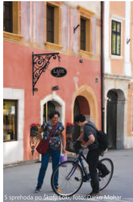
S sprehoda po Škofji Loki