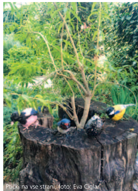
Ptički na vse strani