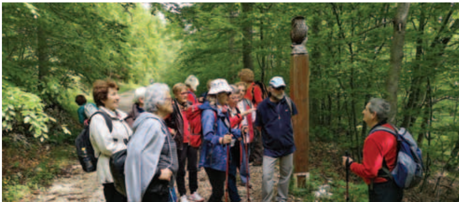
S poti po Učki, arhiv SKD Ajda.

Vabilu so se odzvala društva SKD Ajda iz Umaga, SKD Oljka iz Poreča, SKD Lipa iz Buzeta in SKD Istra iz Pulja, naše vrste pa so okrepili še rojaki iz Matuljev, tako da je bilo skupno več kot 80 udeležencev. Na poteh po Učki se nihče ni izgubil, niti ponesrečil, čeprav so nekateri precenili svoje fizične zmogljivosti. Kuhalo se je pet različnih jedi: SKD Oljka in SKD Istra sta kuhala bograč, SKD Snežnik se je odločil za golaž, SKD Ajda za ričet in SKD Lipa za kislo zelje z mesom. Jedače je bilo veliko, a smo vseeno vse pojedli, saj gorski zrak spodbuja tek. Strokovna komisi-