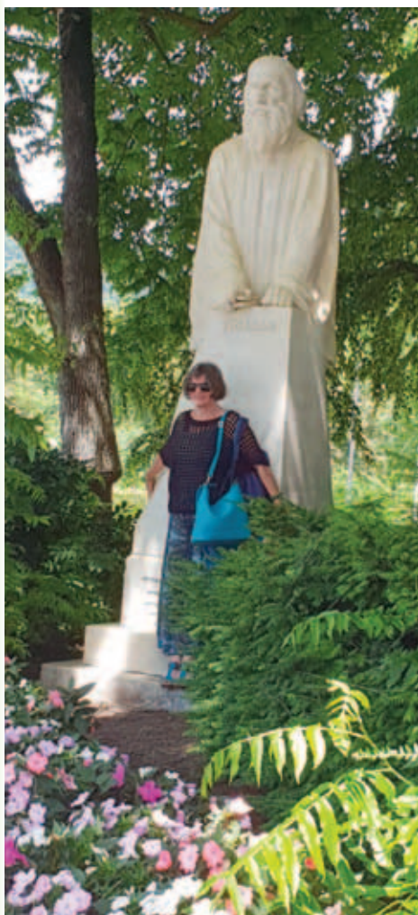
Ljubljano krasijo parki in spomeniki, arhiv skupine.