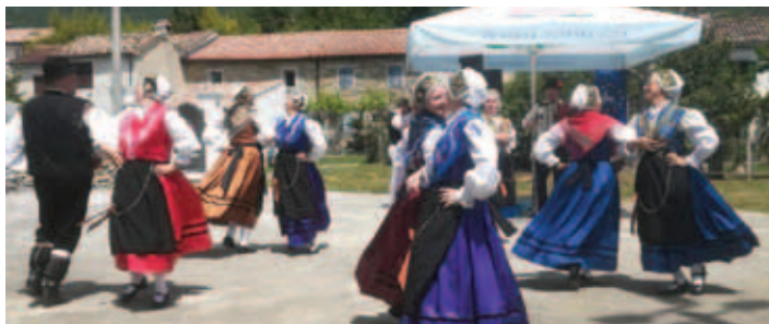
Takšni nastopi vedno zaželeni.

Naša folklorna skupina (FS) se je z veseljem odzvala vabilu SKD Lipa iz Buzeta in tako s svojim nastopom obogatila zanimivo kulturno manifestacijo z naslovom Z besedo in mužiko poli Sv. Duha . Organizator jo imenuje kot "srečanje kulturnih društev in pesnikov kajkavskega dialekta z obeh strani meje".