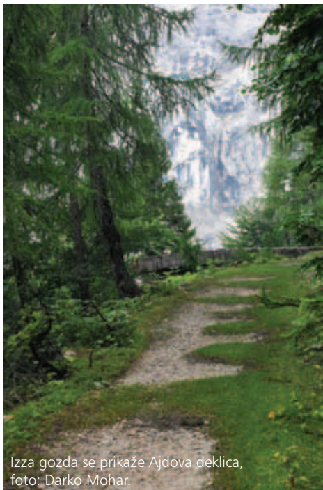
Izza gozda se prikaže Ajdova deklica, foto: Darko Mohar.

Za prvi izlet v jesenskem delu sezone je bil izbran vzpon na več kot 2000 metrov visok Konjski špik nad Mokrinami (Nassfeld) na meji Avstrije in Italije. Prenočevanje je bilo dogovorjeno v Tonkini koči na Vršiču. Žal vremenska napoved in nevihte niso omogočili vzpona na zastavljeni cilj, so pa planinci le obiskali Mokrine in gore nad tem zelo znanim avstrijskim smučiščem. Sprehod po zgodovinski poti jih je seznanil s številnimi