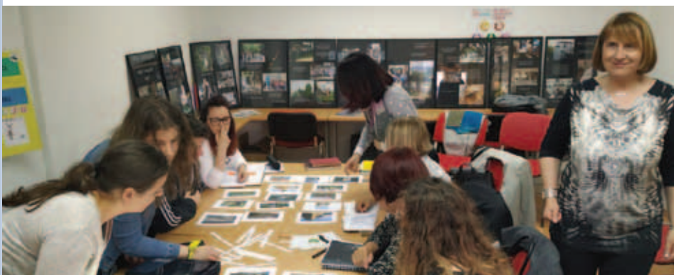
S hospitacije