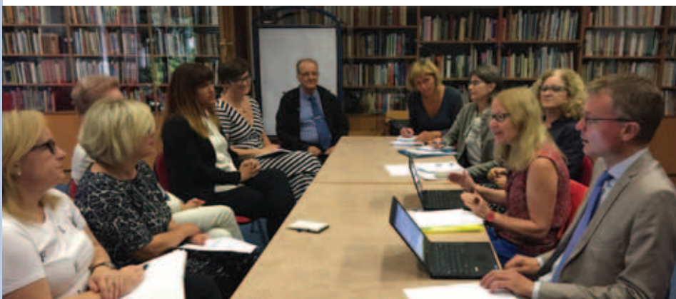
Odbor strokovnjakov ELRMJ (desno) s predstavniki slovenskih organizacij