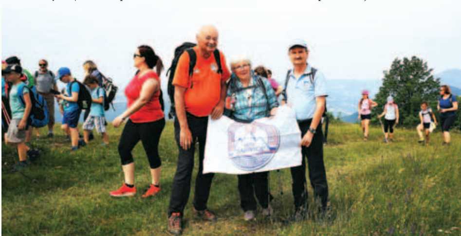
Reški planinci na Lisci, arhiv Milivoja Filipoviča.

krenila kar iz Sevnice, pri čemer je bilo hoje za nekaj več kot tri ure. Nekateri smo se predvsem zaradi vročine raje odločili za ogled nove učne poti po planoti in travnikih na vrhu Lisce. In nismo zgrešili, saj so domačini poskrbeli za dva vodiča – naravoslovca, ki sta imela veliko tega za povedati in pokazati. Okrog koč je bila na ogled še akcija reševanja, otroci so se lahko udeležili številnih ustvarjalnih delavnic, lahko se je plezalo na umetni steni, več kot petdeset praporščakov pa je s svojim mimohodom pripravilo pravi spektakel. Za nas iz KPD Bazovica je bilo sodelovanje kar pomembno, saj so srečanja s člani predsedstva Planinske zveze Slovenije (PZS) zelo pomembna za uspešno poslanstvo skupine.