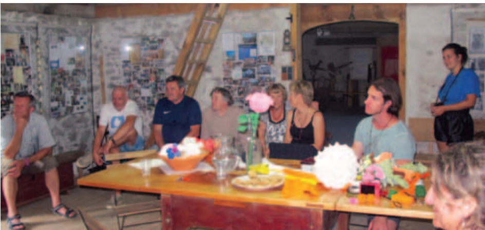
Palčava šiša povezuje vse generacije