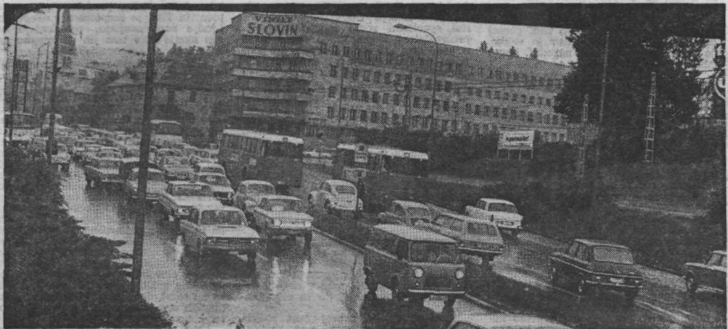
Kako na Gorenjsko? Jasno, skozi center!