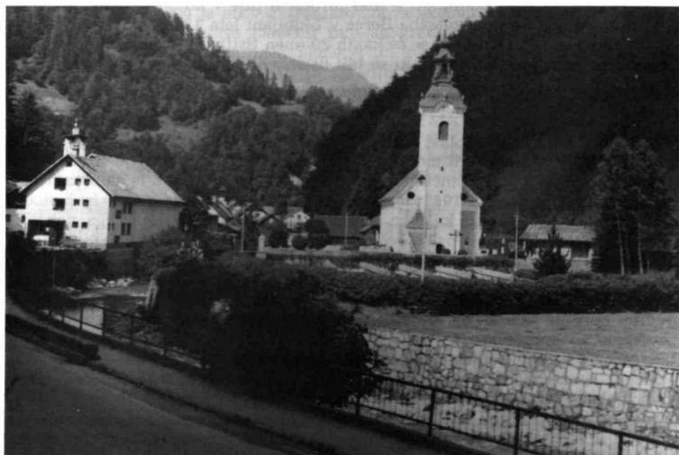
Pokopališče ob cerkvi sv. Frančiška Ksaverija na Logu. Lepo je vidna škarpa ob Sori, ki je bila zgrajena leta 1967.

V drugi svetovni vojni, ki je zajela našo državo, 1941–1945, so bile žrtve znatno večje. V Železnikih je za svobodo padlo in umrlo 62, v Martinj vrhu 20, na Čejnjici in Studenem 15, v Draboslovici, Podlonku in na Prtovčju pa 23 oseb. Skupaj torej 120. Od teh so bile 3 ženske in ena 5-letna deklica. Večina jih je pokopanih na domačem pokopališču.