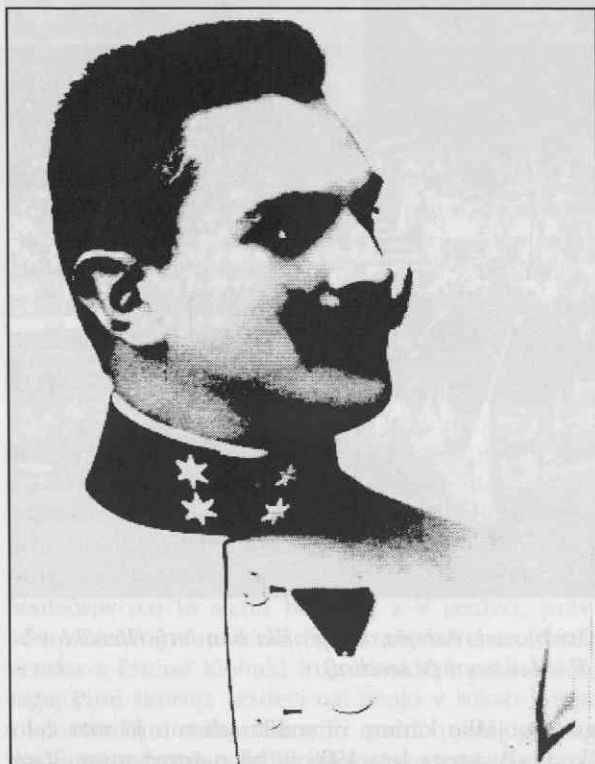
Rudolf Maister kot nadporočnik.

Kakršnakoli je že bila sodba o dunajskem sprevodu, velja, da je Maister z ostalimi slovenskimi vojaki svoje poslanstvo opravil vojaško korektno in v ugled svoje dežele.