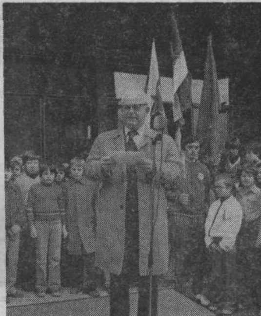
Pozdravni govor na Starem Vodmatu