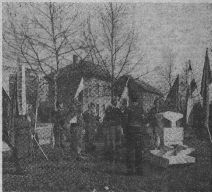
Udeleženci ljubljanske štafete polagajo venec