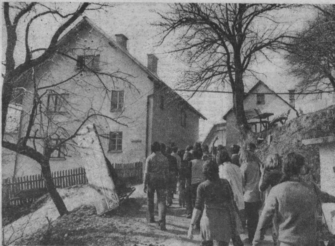
Proslava na Čebinah bo v soboto, 16. aprila 1977 ob 15. uri. Prireditveni prostor je nad Barličevo domačijo, v kateri je bil pred štiridesetimi leti Ustanovni kongres KPS.