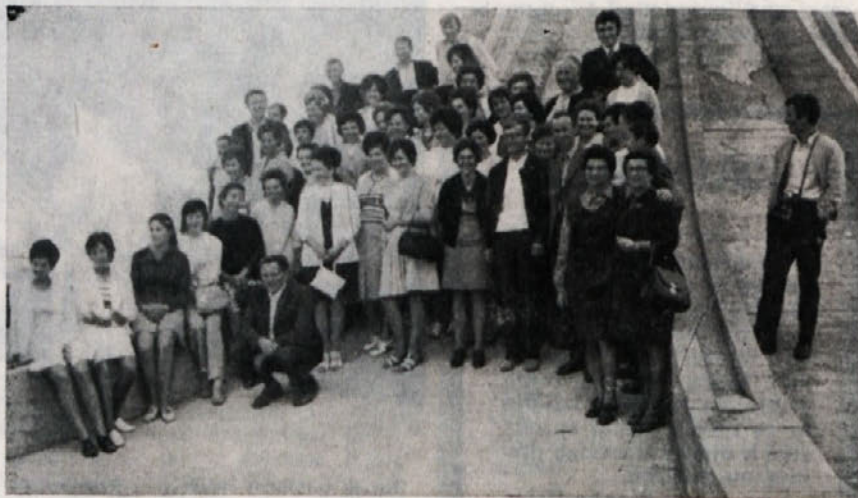
Zaposleni iz obrata Dobove, fotografirani pred spomenikom v Jasenovcu.