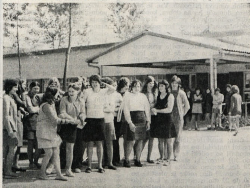
Med odmorom v zadnjih dneh pouka na poklicni šoli. Vesela mladost kar žari iz deklet, ki bodo svoje znanje kmalu pokazale v proizvodnji. Za pridne in požrtvovalne delavke obstaja možnost nadaljnega izobraževanja na oddelku srednje tekstilne šole.