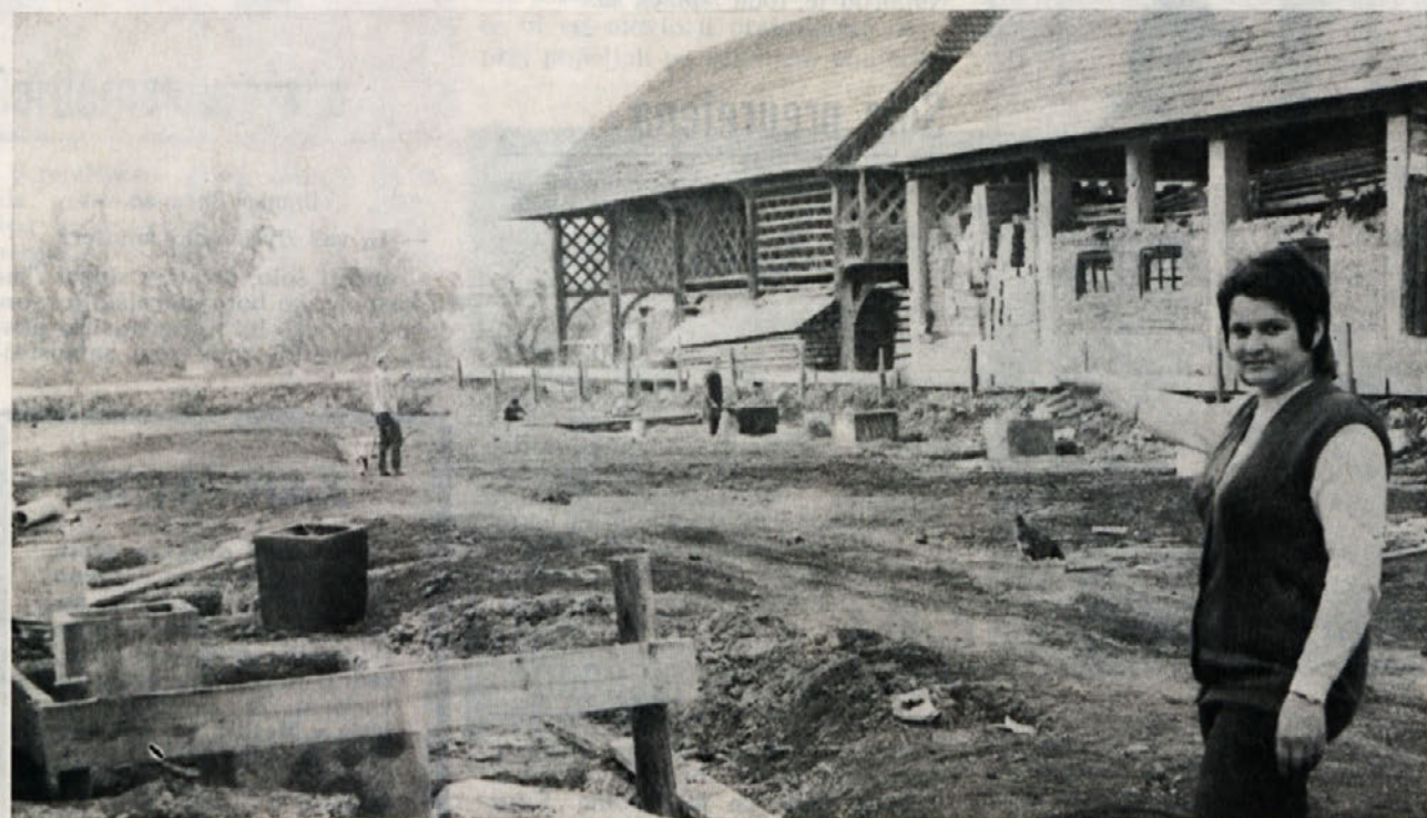
Mlada mojstrica z obrata BETI Mirna peč kaže gradbišče nove proizvodne hale.

Pred izidom številke je to le skromna informacija, obširneje pa bomo o tem spregovorili v prihodnji številki