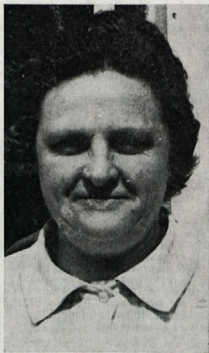
predsednico sindikata najbolj zaposluje?

»V teku je akcija za zbiranje pomoči poplavlencem v Pomurju. Imamo sestanke, kjer se kolektiv odloča o pomoči. Naši so pripravljani dati, želijo pa, da bo naš prispevek prišel zares v prave roke.«