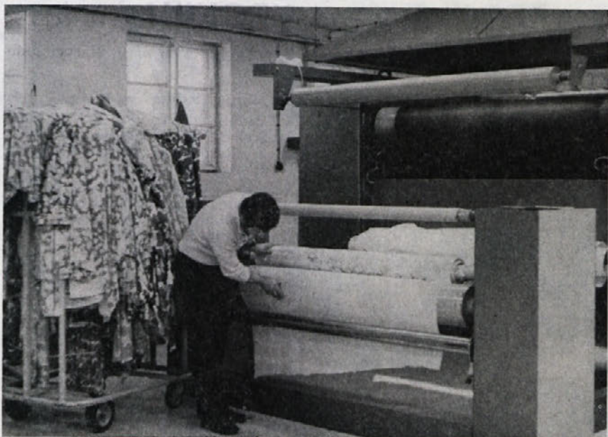
Tiskarski stroj, nabavljen lani, je bil precejšnja naložba, ki pa se je izplačala. Tudi nova modna kolekcija za sezono 1973 je sestavljena pretežno iz potiskanih vzorcev.