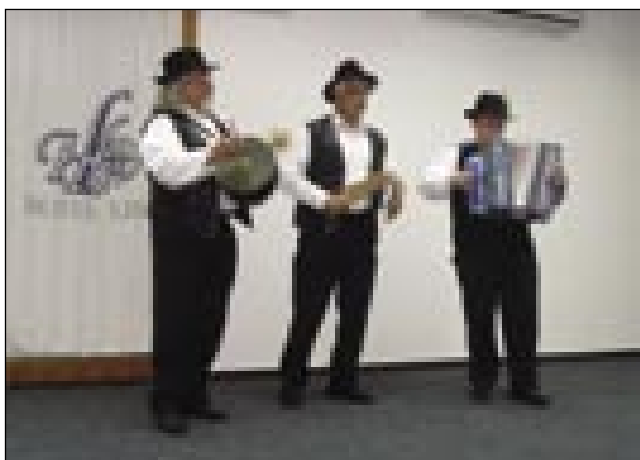
Skupina Porini pa počini iz Miklauža pri Ormožu

Te den si je vsakši leko dau zmeriti krvni pritisk (vér-