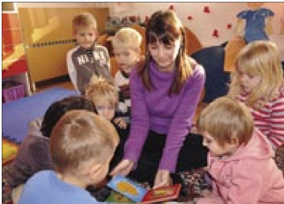
Med malčki v gornjeseniškem vrtcu

»Na internetu sem, gledam televizijo pa pripravljam se na pouk. Zdaj mi je še popolnoma v redu tako, potem pa bom videla, kako bo.«