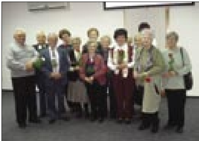
Člani društva, steri so starejši od 75 lejt

spadne, če malo leko vkūp pridemo, se pogučavamo in se veselimo. Zato pa vsigdar mamu kulturni program, kakšno predstavo, predavanje in večerjo z muziko. Zdaj smo meli goste iz Miklauža