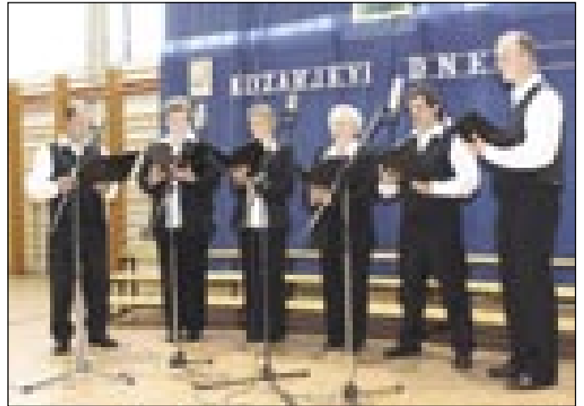
Gorenjesenički ljudski pevci so spejali na vsej srečanjaj