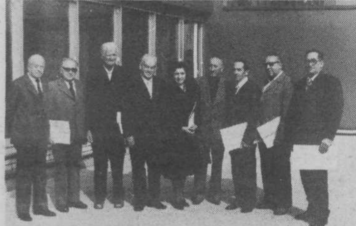
Člani prvega delavskega sveta Emone — bivše Prehrane — ki se je konstituiral 12. septembra leta 1950