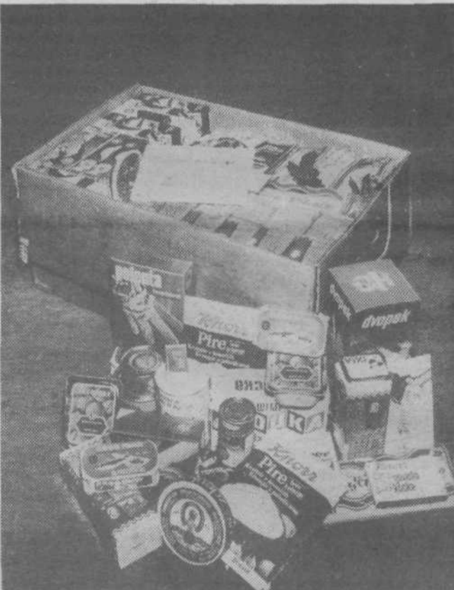
Paket DANES IN JUTRI 84 se predstavlja

Kolinske. »Predstavniki nasega podjetja se bodo povezali s tovarnami in ustanovami, tako da bo imel res vsakdo možnost za nakup novega in dopolnitev starega paketa.« Obenem je še dejal, da so prvih 100 paketov že poslali na potresno območje v Črno goro. Pakete so tudi razstavljali na sejmju civilne zaščite, ki je bil prve dni junija v K: nju. Kot zanimivost naj navedemo še nekaj izdelkov v paketu rezervne hrane: razni instant napitki, instant polenta, sardine, ribe z zelenjavo, različne juhe, preliv za