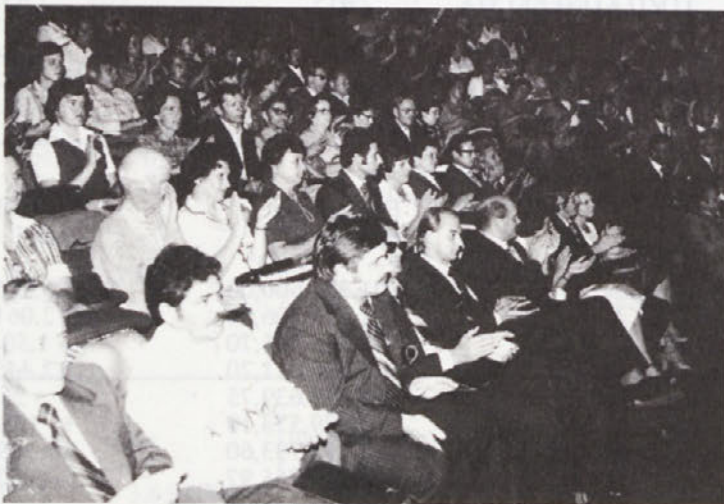
Številni gostje, delavci in upokojniki Novoteksa med proslavo