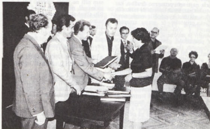
V tovarni so dobili priznanje 10 in 20 letniki