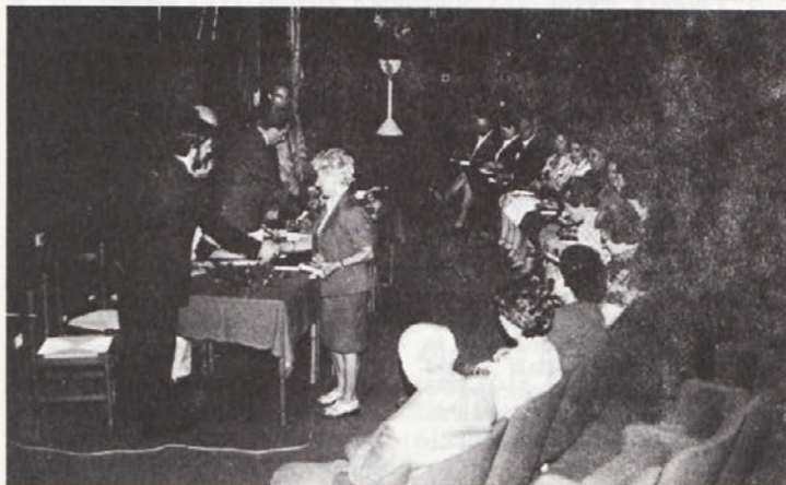
Svečana seja DS