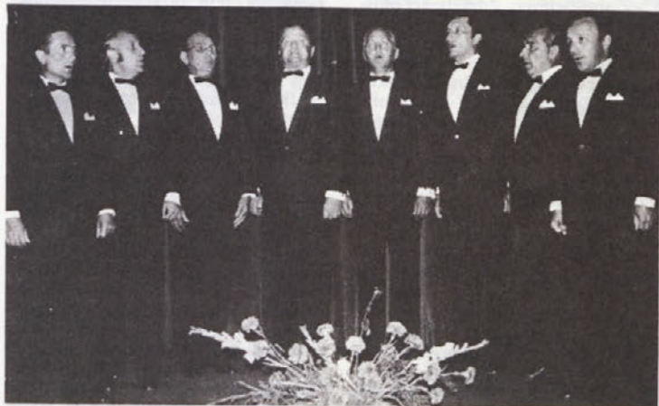
Največ aplavza je požel Slovenski oktet