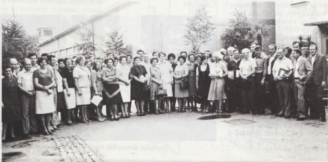
Po podelitvi priznanj so se jubilarje slikali na tovarniškem dvorišču