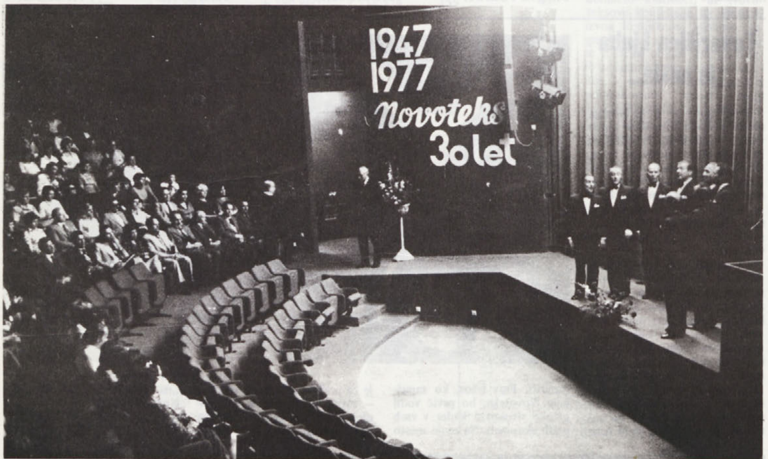
Pogled na nabito polno dvorano v Domu JLA in nastop Slovenskega okteta