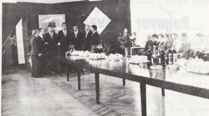
K prazničnemu vzdušju je pripomogel tudi Dolenjski oktet