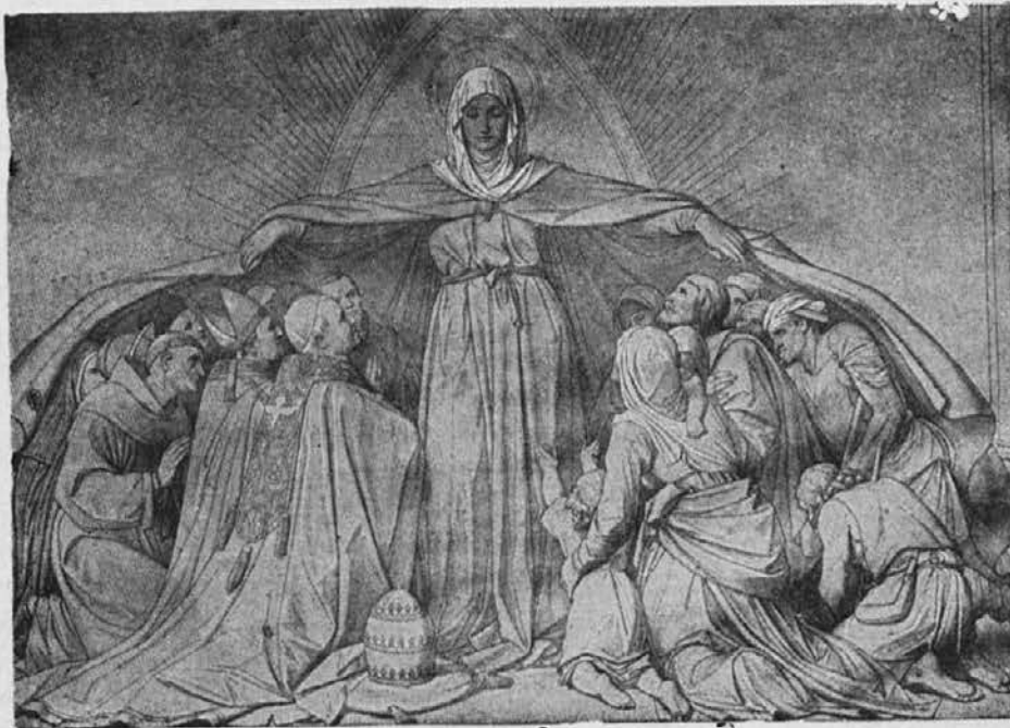
Pod plaščem Majniške Kraljice.