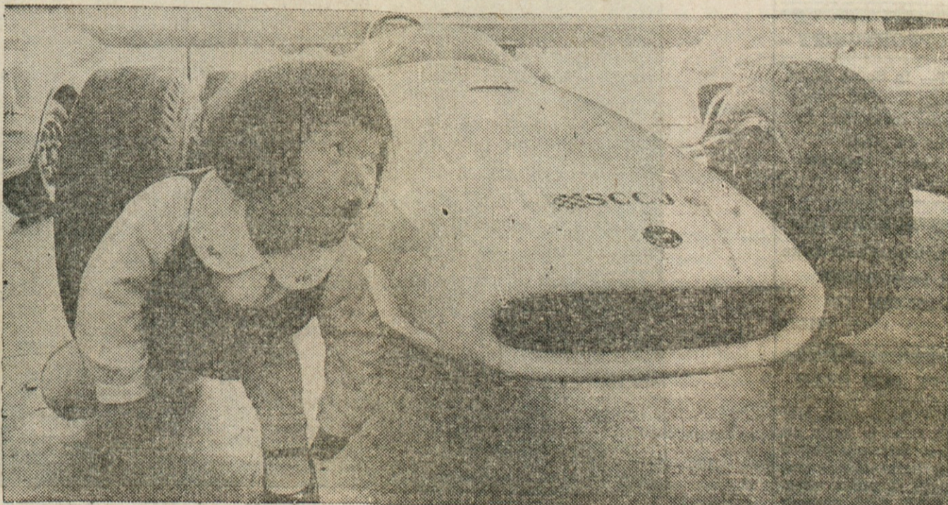
Z ODPRTIMI USTI — Dirkalni avto Repco Brabham in njegova mala občudovalka v Tokiu s široko odprtimi usti.

Oprava naprodaj Radi selitve prodam dobro ohranjeno pohištvo za 4 sobe, v dnevni sobi skoro nova garnitura, Maytag pralnik, plinski štedilnik, hladilnik. Kličite 361-7294. (3,5,7 jun)