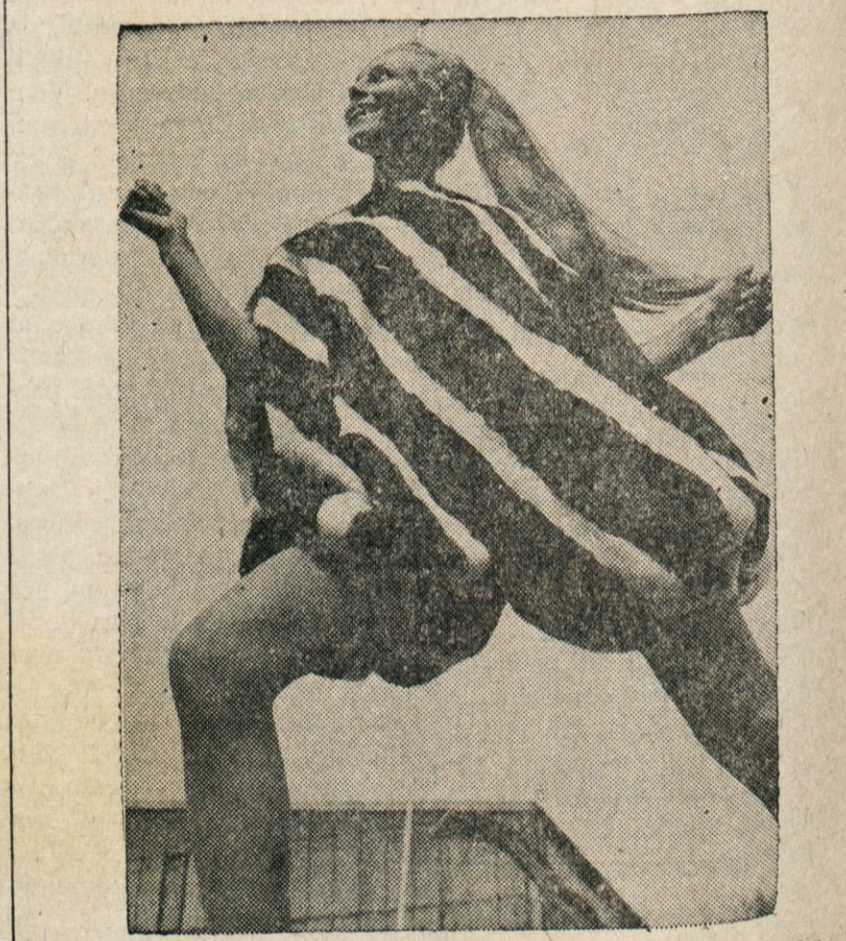
V KRZNU — Neki krojilec ženske mode je nedavno pokazal tole krzveno vrečasto oblačilo za mlada dekleta.