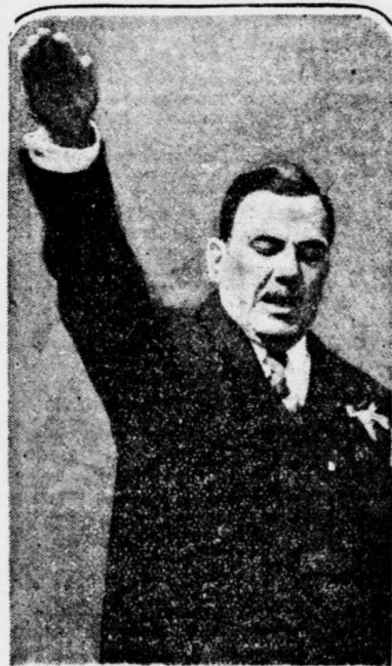
Mehčki predsednik Calles bo sedaj po umoru novozvoljenega predsednika Obregonu po vsej priliki poverjen z nadaljnjim vodenjem najvišjih državnih poslov.

Terezijin oče; da bi jo kontrolirala kakšna komisija dan in noč na domu — tega ne dovoli cerkvena oblast. Z njenim posebnim dovoljenjem je sploh ne sme nihče obiskati in z njo govoriti. In s tem je za resne ljudi zadeva opravljena — tudi za slučaj, da Neumannova ne laže in da se v resnici post 19 mesecev... kadar se zaveda, kaj se ž njo dogaja. Če drži ta post tudi takrat, kadar se ne zaveda in kadar je prepuščena svoji okolici, ki kontrole ne dopušča: to je stvar, v katero lahko verjameš ali pa ne! Trezno možgani imajo pravico ne verjeti.